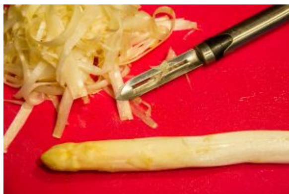
Pelez les asperges blanches