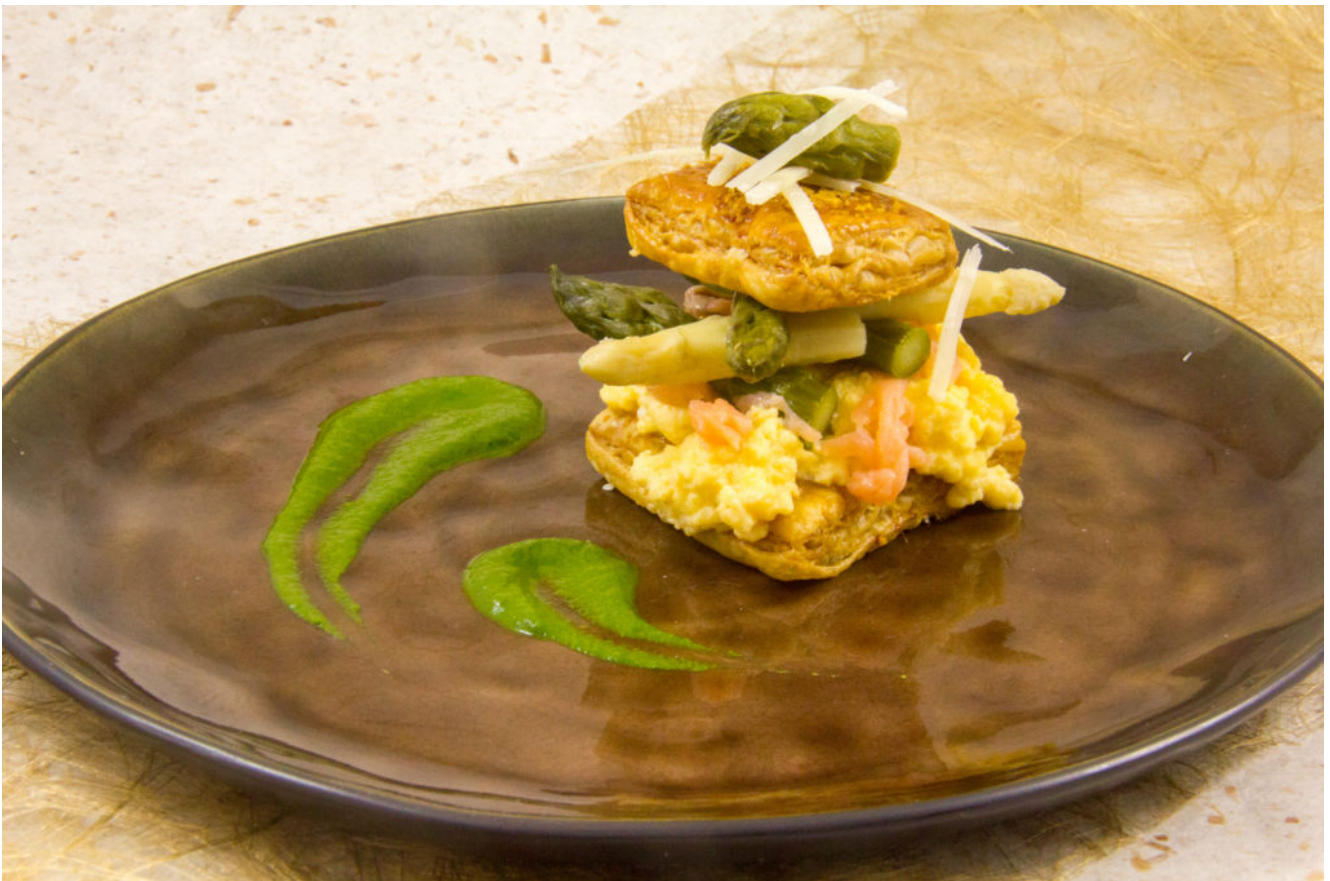
Feuilleté d'asperges basse température