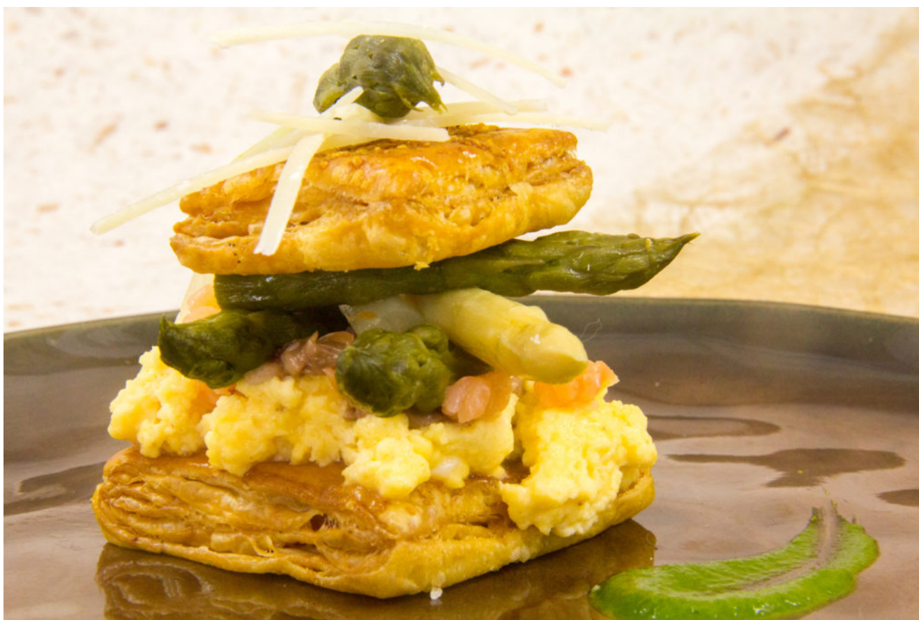
Feuilleté d'asperges basse température

Asperges, parmesan, œuf brouillé et saumon, voici un quarté gagnant! Alors à vos fourneaux et vous allez vous ravir vos petites papilles avec ce Feuilleté d'asperges cuites basse température!