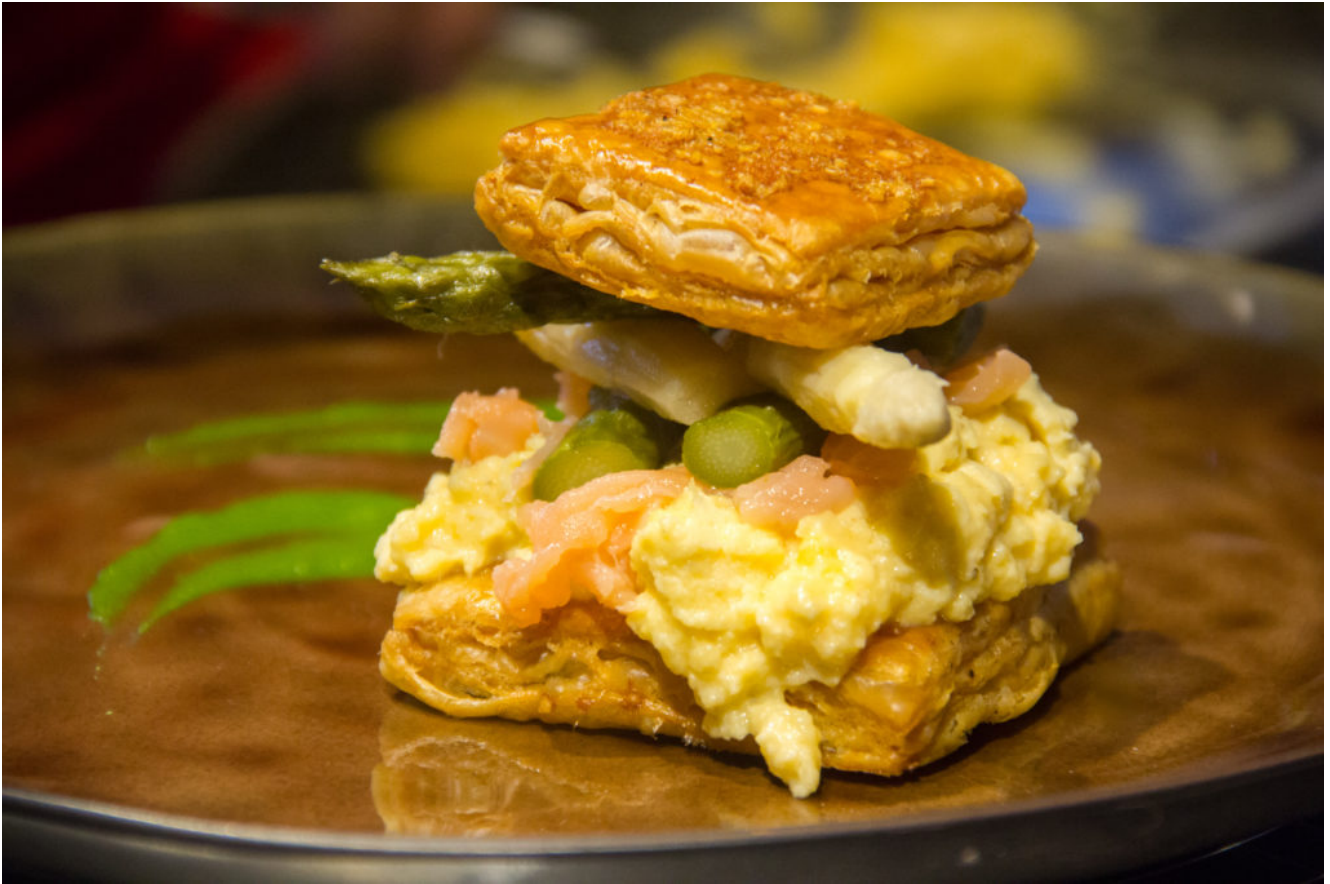
Feuilleté d'asperges basse température