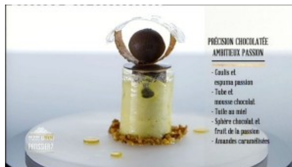
Précision chocolatée Ambitieux passion