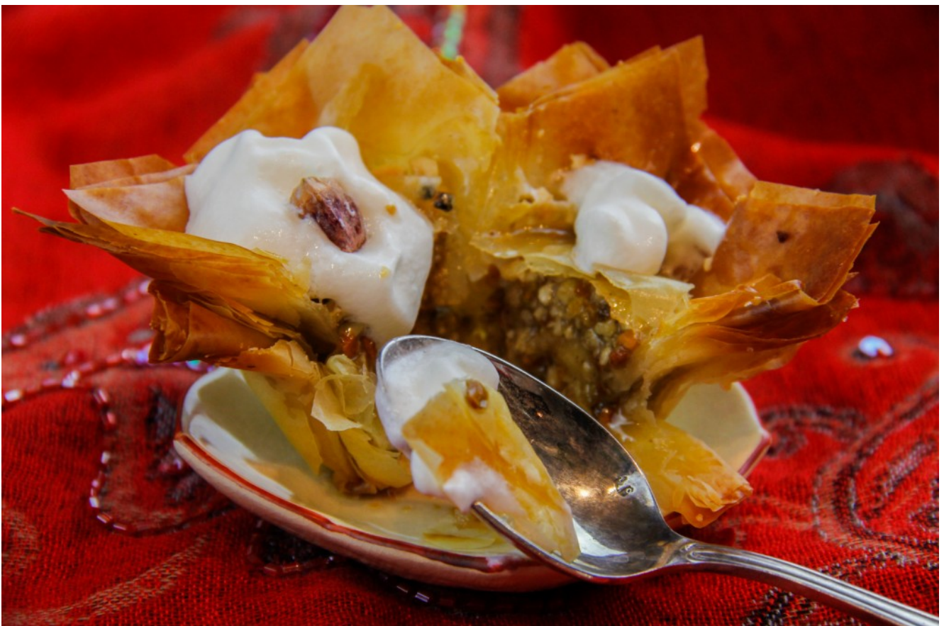
Le Baklava, le sultan des gâteaux