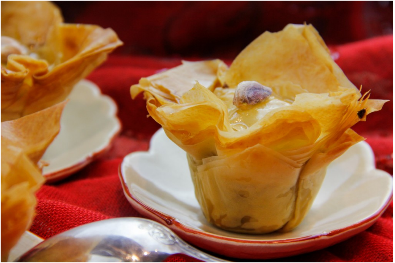
Le Baklava, le sultan des gâteaux