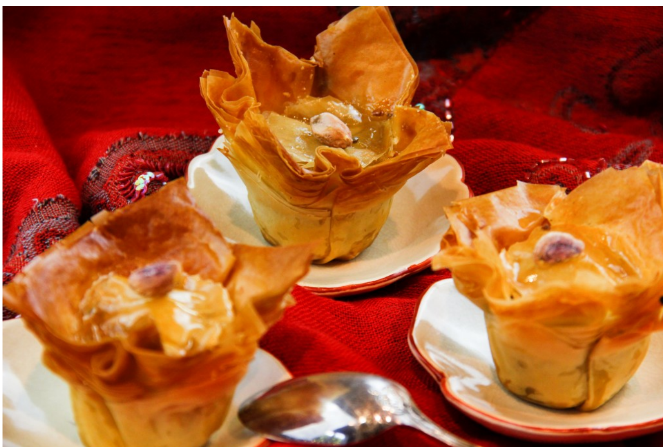
Le Baklava, le sultan des gâteaux

Je vous en propose une version en petits gâteaux individuels beaucoup plus élégante que la version traditionnelle présentée dans un grand plat et coupée en losanges.