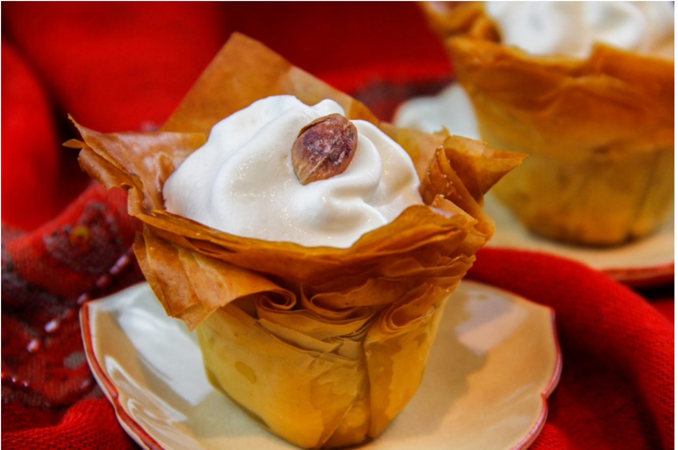
Le Baklava, le sultan des gâteaux