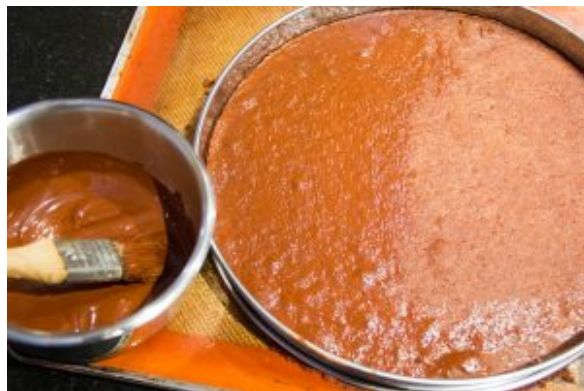
Recouvrez la surface de la pâte d'une fine pellicule de chocolat