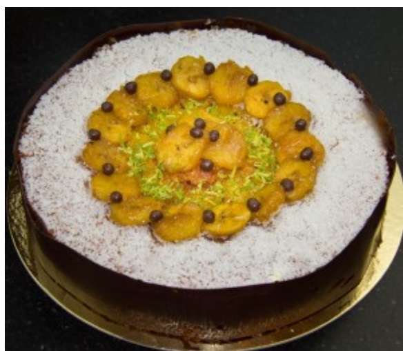
Bourdaloue à l'ananas

Comme beaucoup d'entre vous, je regarde "Le meilleur Pâtissier" avec Mercotte et Cyril Lignac. Dans la prochaine émission, une des épreuves portera sur les gâteaux aux fruits et en particulier une Bourdaloue à l'ananas. Je n'en ai pas la recette mais je me suis fait un plaisir que d'en imaginer une... Un sablé bien croustillant et caramélisé, une crème de noix de coco onctueuse et agrémentée de petits dés d'ananas acidulés, une jolie présentation... Et le résultat est délicieux! Voici donc ma version de la Bourdaloue à l'ananas.