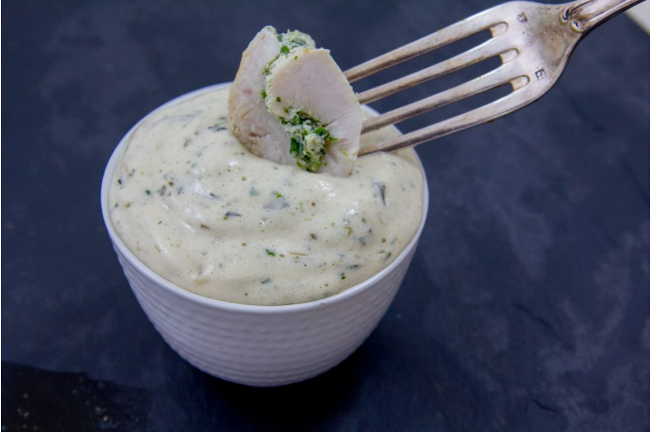
Béarnaise très light et sans beurre

totalité du beurre par du lait concentré non sucré monté en chantilly: le résultat est époustouflant de légèreté sans que le goût n'ait à en souffrir, bien au contraire! C'est simple, je ne réalise plus la béarnaise qu'en utilisant cette recette.