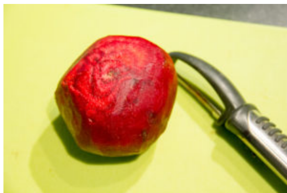
Épluchez les betteraves