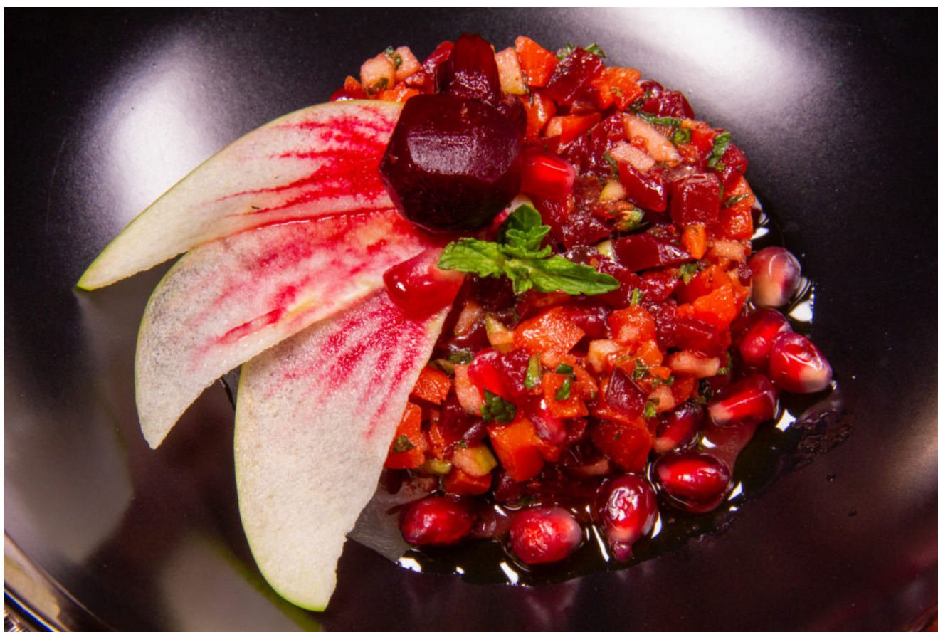
Salade fruitée carotte et betterave (recette sous vide basse température)

Pour plus de renseignements sur la cuisine sous vide basse température cliquez ici .