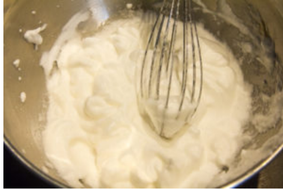
Montez la crème en chantilly