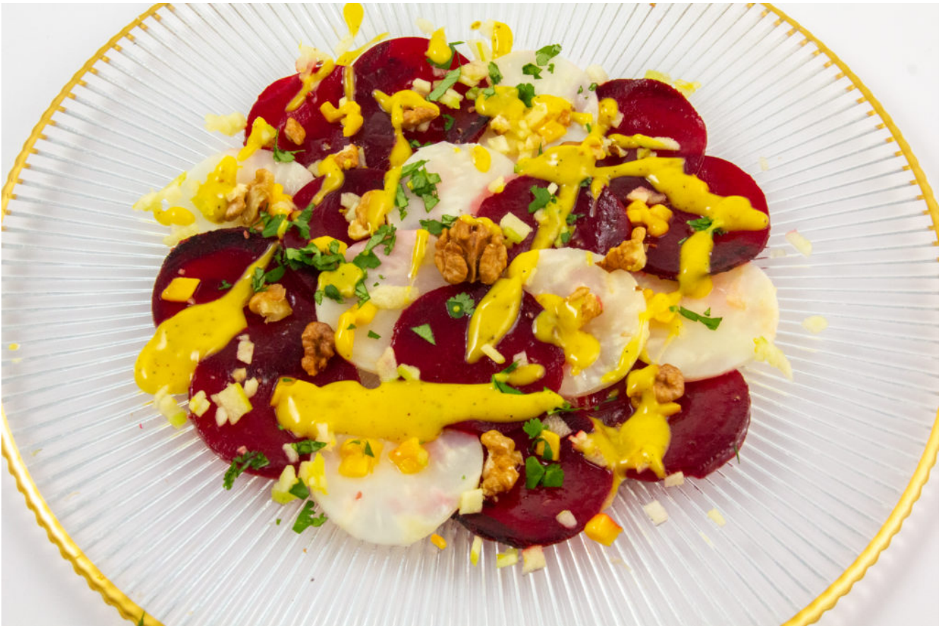
Carpaccio fruité betterave et céleri (recette Basse température)