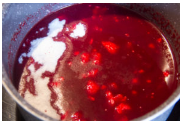
Chauffez le jus de betterave