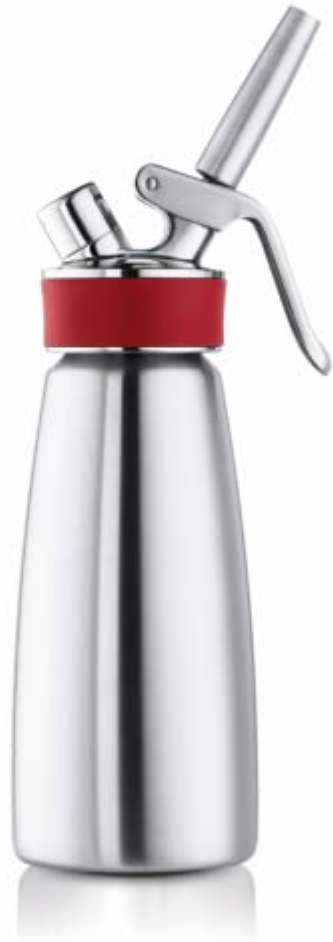
iSi 1603 Siphon