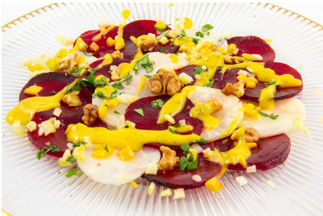
Carpaccio fruité betterave et céleri (recette Basse température)

Pour plus de renseignements sur la cuisine sous vide basse température cliquez ici .