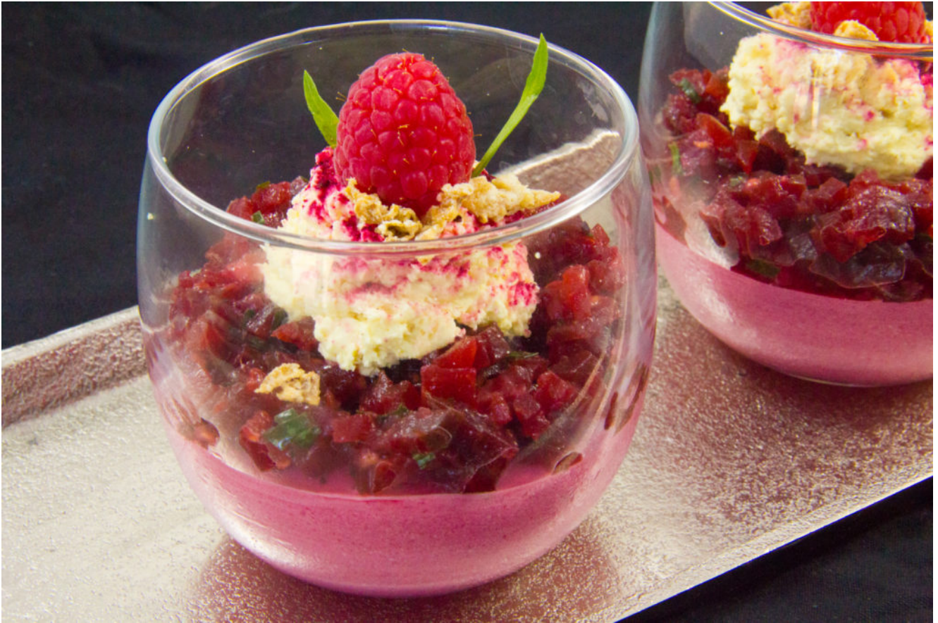
Fraîcheur de betterave basse température aux framboises, mousse de chèvre