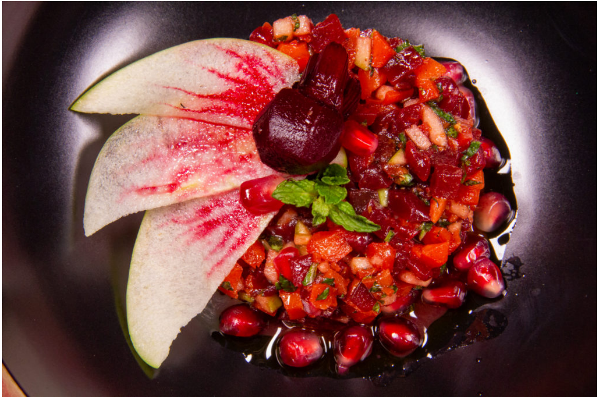
Salade fruitée carotte et betterave (recette sous vide basse température)

vinaigrette sur chaque lamelle de pomme et à l'aide d'une pointe de fourchette tirez la goutte vers l'extérieur pour dessiner des petites nervures rouges...comme une fleur.