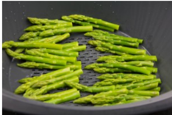
Cuire les asperges à la vapeur