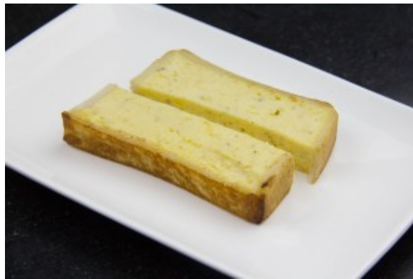
Coupez chaque tranche de pain de sole en deux