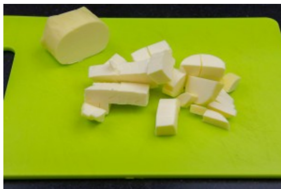
Coupez le beurre en morceaux