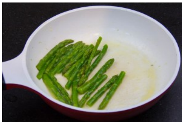
Passez les dans une poêle avec un peu de beurre