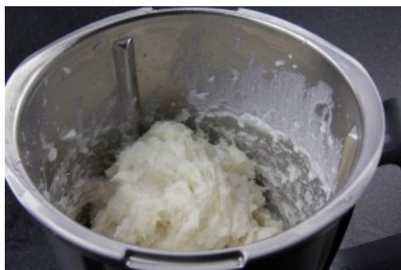
Mixez les filets de sole