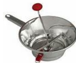
moulin à légume