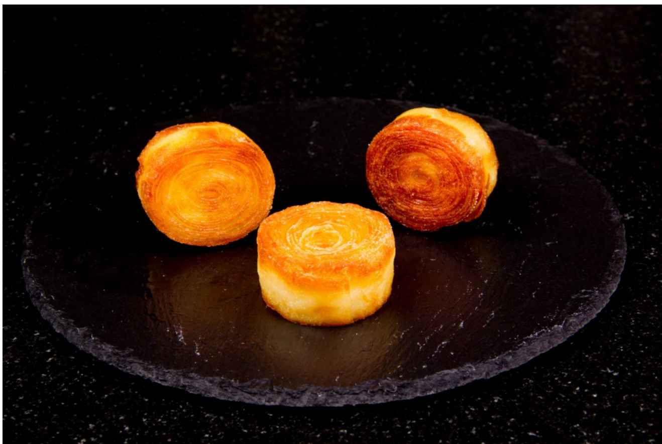
Pommes de terre croustifondantes

Lors d'une émission de Top Chef 2014 Thierry Marx nous a proposé un plat de bœuf et pommes de terre; la préparation des pommes de terre m'a particulièrement intéressée de par la découpe particulière et le mode de cuisson alliant cuisson basse température et cuisson dans du beurre clarifié. Le résultat était magnifique: les pommes de terre semblaient très croustillantes et moelleuses à la fois. Gourmande comme je suis il fallait que j'y goûte!