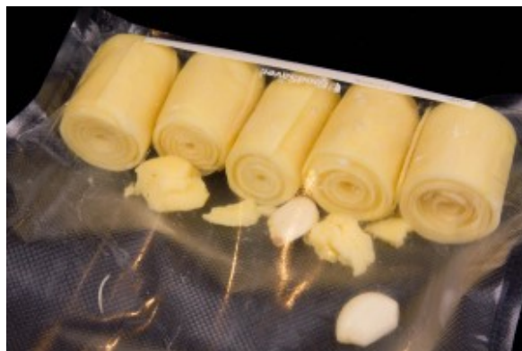
Mettre les pommes de terre sous vide