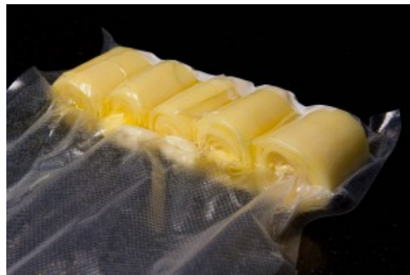
Pommes de terre après cuisson

°. Si vous n'avez pas de machine spéciale pour la cuisson basse température immergez votre sachet dans un récipient d'eau à 90° et cuire au four au bain marie 60 mn à 90°. Le sachet doit être recouvert d'eau pendant toute la cuisson et ne pas flotter à la surface du récipient. Je tiens à préciser que je n'ai jamais utilisé ces sachets zip au delà des 83° donc il vous faudra tester. J'utilise surtout les sachets zip quand j'introduis un liquide dans le sachet avec la viande ou quand je fais une crème anglaise: je ne peux alors utiliser une machine à mettre sous vide car le liquide serait complètement aspiré par la machine. Donc avec les sachets zippés et en utilisant la méthode du vide par immersion du sachet dans l'eau je peux quand même avoir un sachet hermétique dans lequel j'ai fait le vide... Mais dans la mesure du possible je préfère utiliser les sachets fabriqués pour la mise sous vide qui sont faits pour cet usage et pour une cuisson proche de 100°.