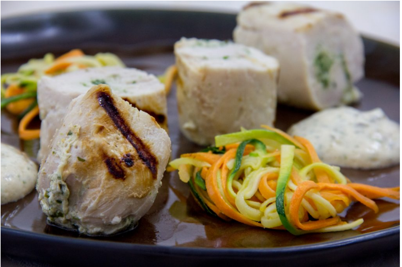
Blanc de volaille farci aux herbes et ses petites carottes, béarnaise légère sans beurre (recette basse température)