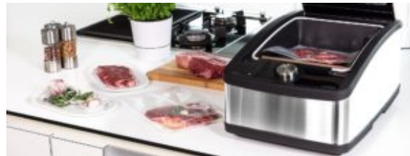
Home de Multivac

profitez d'une réduction de 50 euros sur votre achat en utilisant le code promo "Gourmantissimes50"