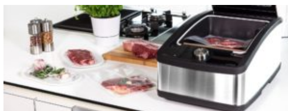
Home de Multivac