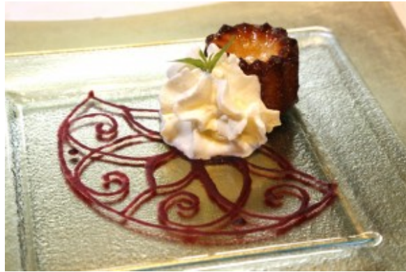
Canelé en rosace de coulis de betterave et chantilly à la verveine