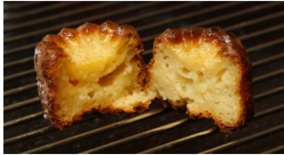
le cœur moelleux