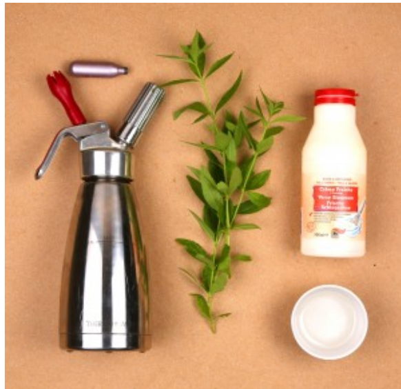
Ingrédient et matériel pour la chantilly à la verveine