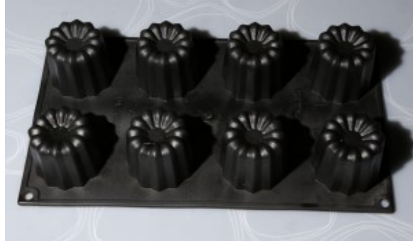
moules à canelés en silicone