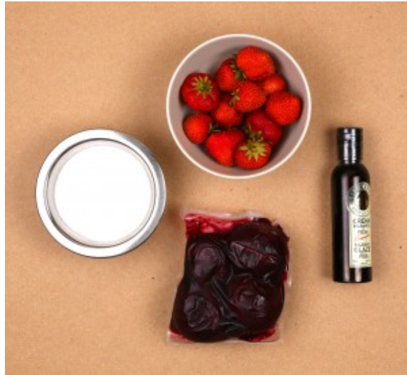
Ingrédients du coulis betterave et fraise