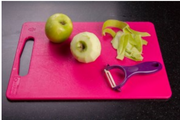
Épluchez les pommes