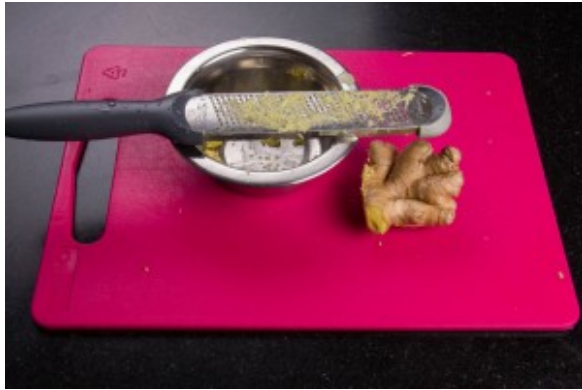
Râpez le gingembre