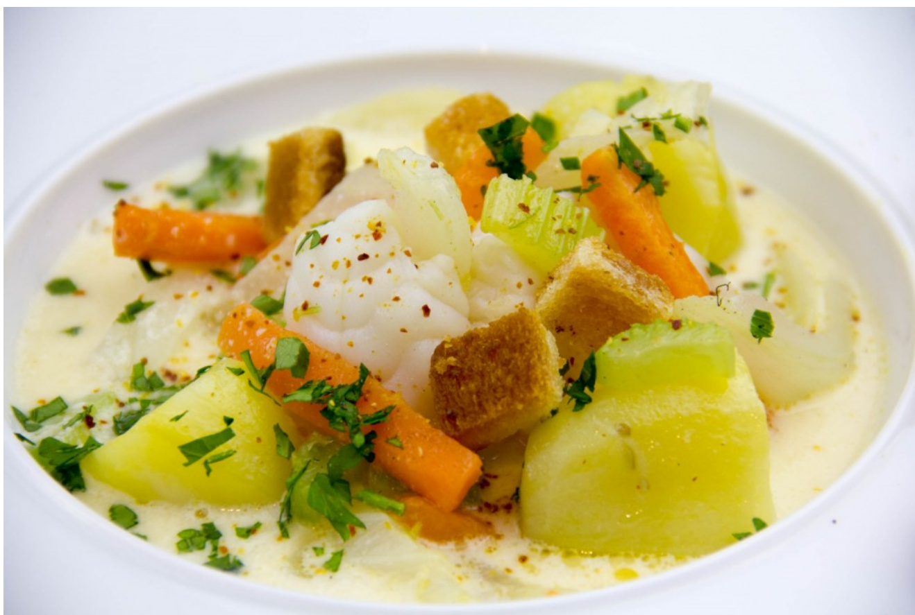
Bourride de lotte basse température

Et voilà une recette basse température qui va encore vous ravir... la bourride provençale avec une lotte bien tendre et goûteuse. Elle m'a été inspirée par une recette donnée par le chef Philippe Etchebest lors d'une émission « Cauchemar en cuisine ».