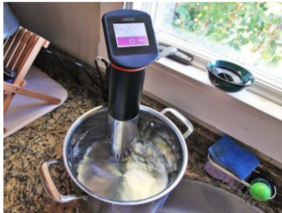
Anova sous vide circulator