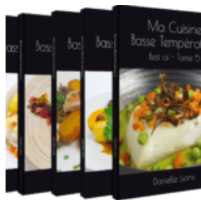
Tomes 1, 2, 3, 4, 5

la parution de mes meilleures recettes basse température.