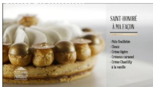
Saint Honoré à ma façon