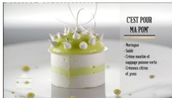
C'est pour ma pom'