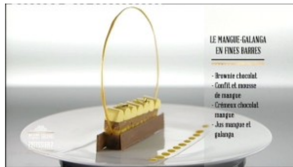
Le Mangue Galanga en fines barres