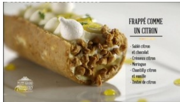
Frappé comme un citron