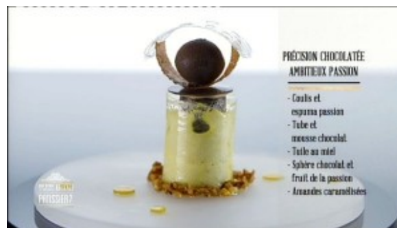
Précision chocolatée Ambitieux passion