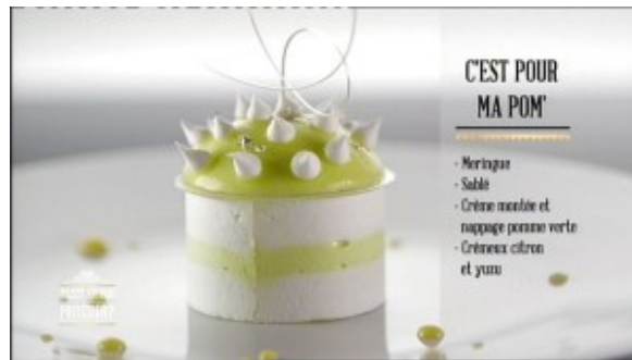
C'est pour ma pom'