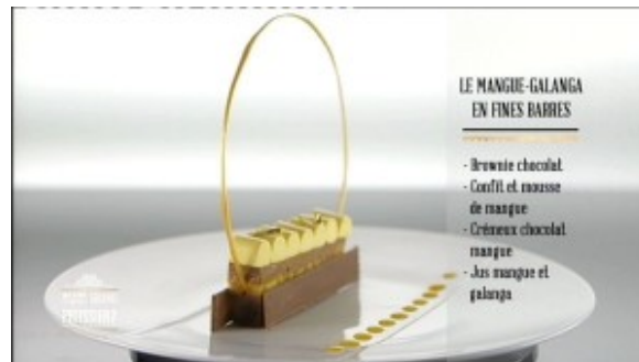
Le Mangue Galanga en fines barres