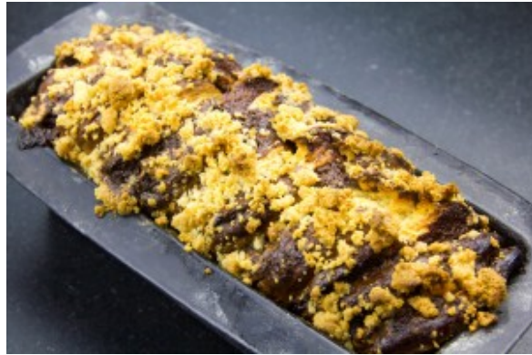
Le kranz cake à la sortie du four