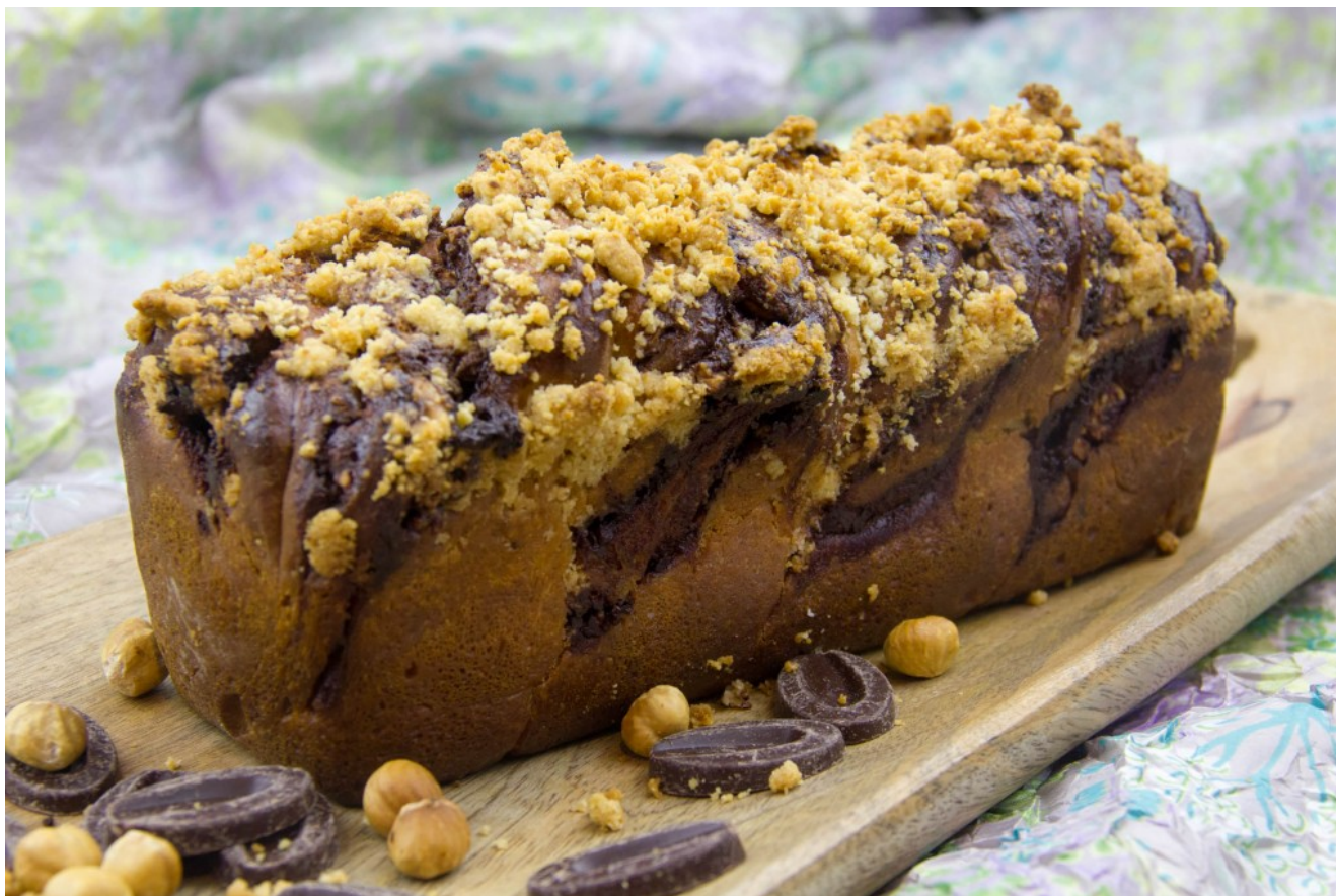
Le Krantz cake

avec le chocolat... Ce gâteau se nomme également Babka au chocolat.