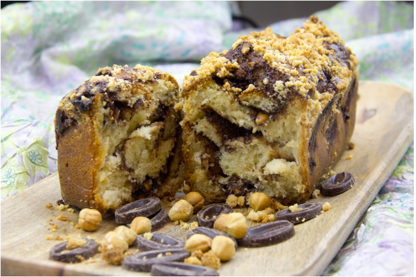
Le Krantz cake