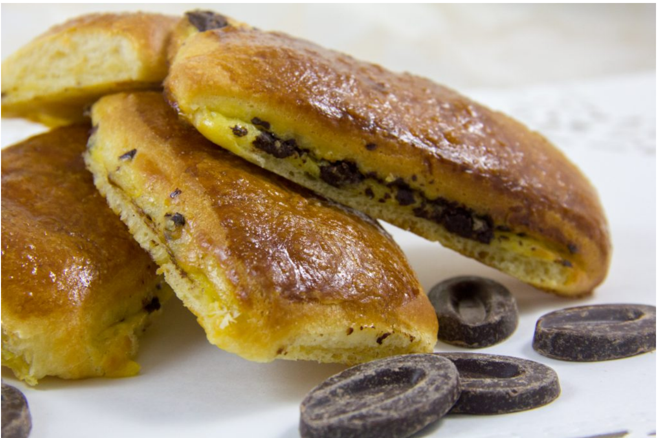
Brioche suisse (fourrée crème pâtissière et chocolat)