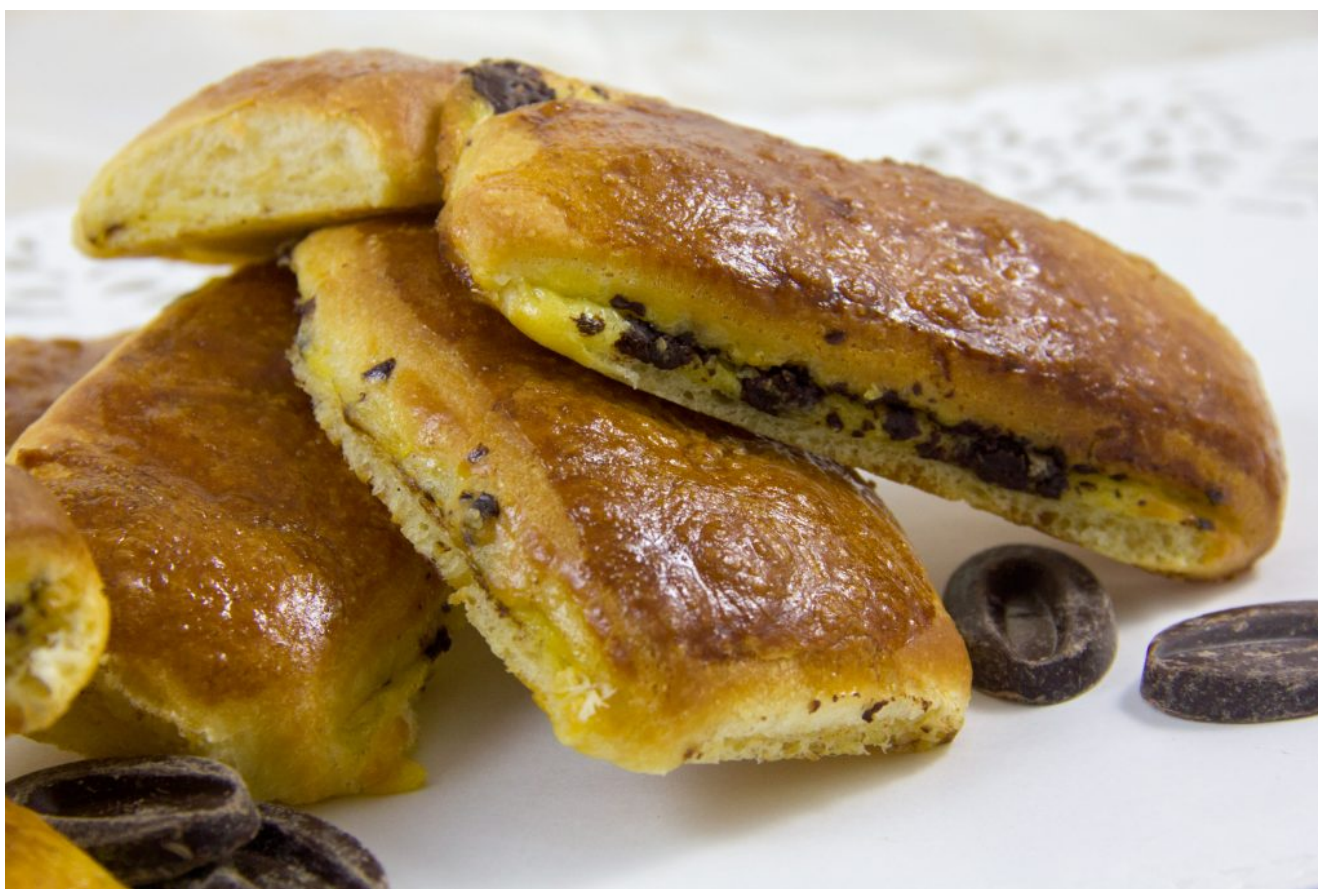
Brioche suisse (fourrée crème pâtissière et chocolat)

Pour varier les plaisirs de la brioche de Pâques voici une recette classique que j'adorais (et que j'adore toujours) étant petite: la Brioche suisse. C'est un excellent goûter pour vos enfants: je suis sûre qu'ils vont adorer!