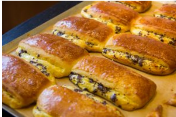
Brioche suisse (fourrée crème pâtissière et chocolat)

Et voici les petites gourmandises toutes chaudes à la sortie du four!