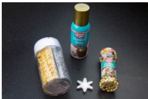
Décorations de Noël pour gateaux