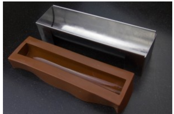
Moule à bûche avec insert Alice Délices