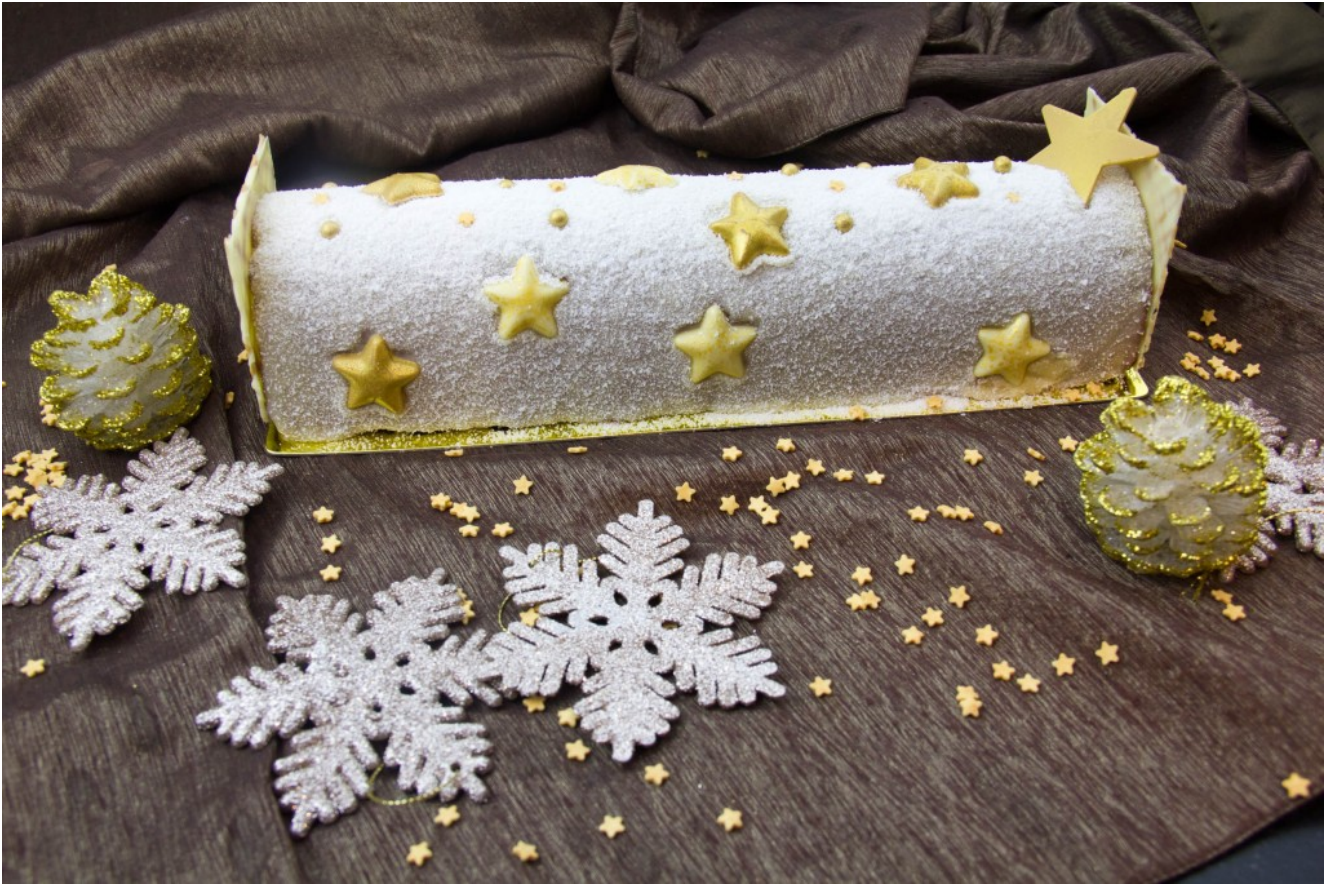
Ma bûche de Noël: L'Etoile scintillante