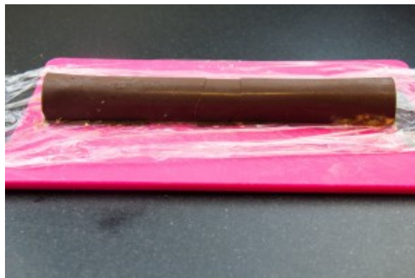
Démoulez délicatement l'insert.