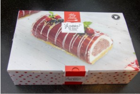
Moule à bûche Alice Délices