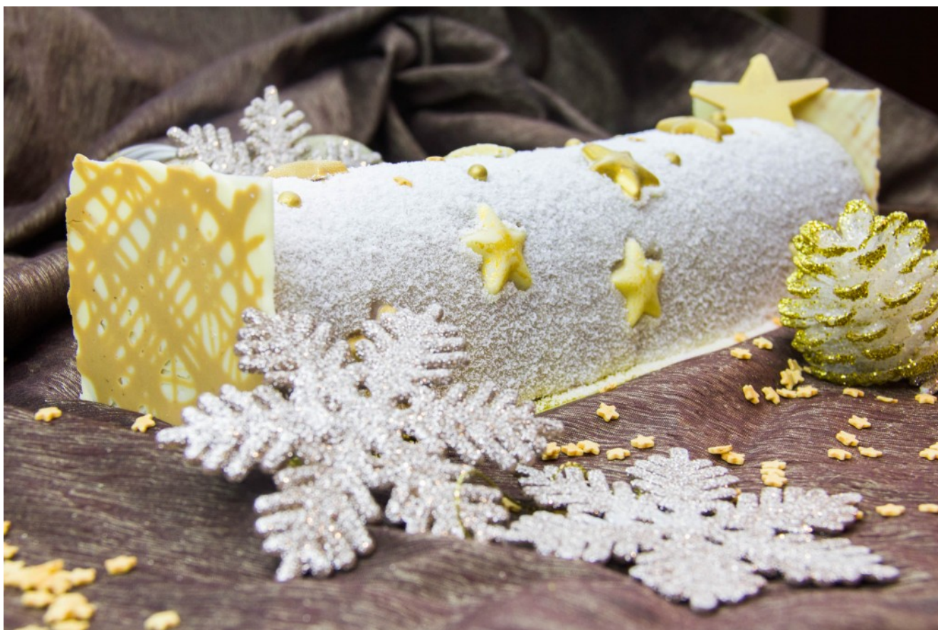
Ma bûche de Noël: L'Etoile scintillante

Finale de l'émission « Le Meilleur Pâtissier » 2015... Cyril Lignac, Mercotte et Philippe Conticini nous font rêver avec les desserts ou gâteaux glacés de Noël. Il faut dire que la bûche est le point d'orgue et l'apothéose de votre repas de Noël... Sa présentation doit être magique. Voici celle que j'ai imaginé pour vous cette année: L'Etoile scintillante, mousse au chocolat, insert croquant au chocolat et marrons et une décoration féérique qui finira en beauté votre repas.