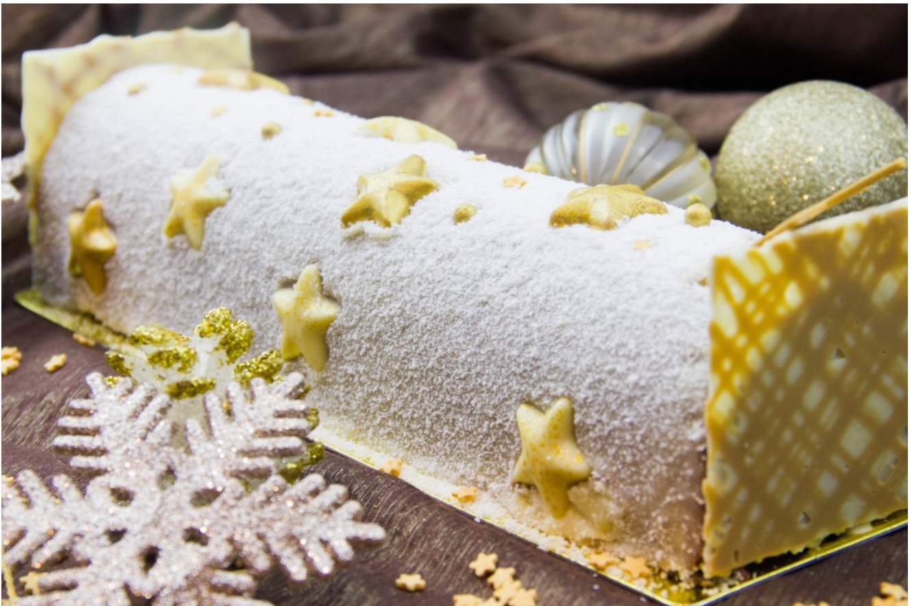
Ma bûche de Noël: L'Etoile scintillante