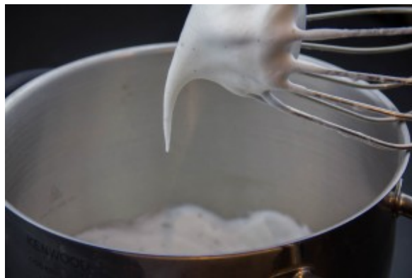
Montez les blancs en neige au fouet