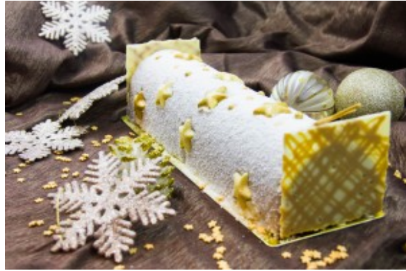
Ma bûche de Noël: L'Etoile scintillante

noix de coco pour faire une effet neige, placez vos étoiles et petites boules dorées...Laissez jouer votre imagination en fonction des décorations que vous avez trouvées ou fabriquées). Et remettez la bûche au congélateur. Sortez la une heure avant de la déguster.