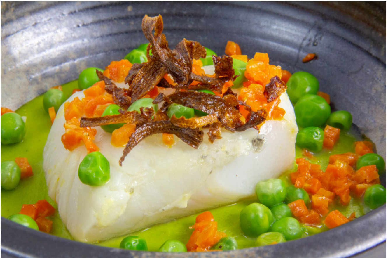
Cabillaud à l'orange basse température, royale de petits pois