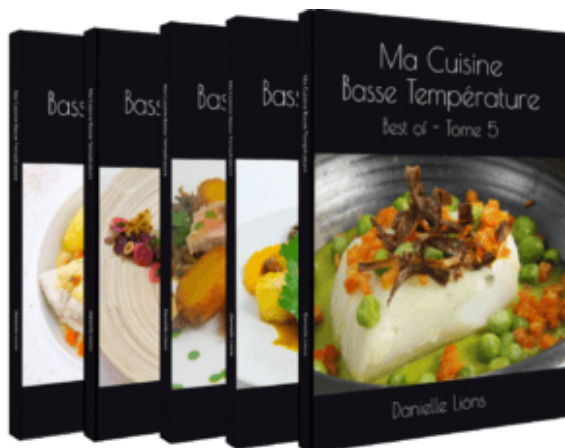
Tomes 1, 2, 3, 4, 5

cuisine basse température-Tome 5 ». Les livres sont disponibles dès maintenant en version brochée ou en version Kindle.