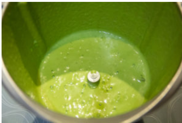
Mixez les petits pois finement