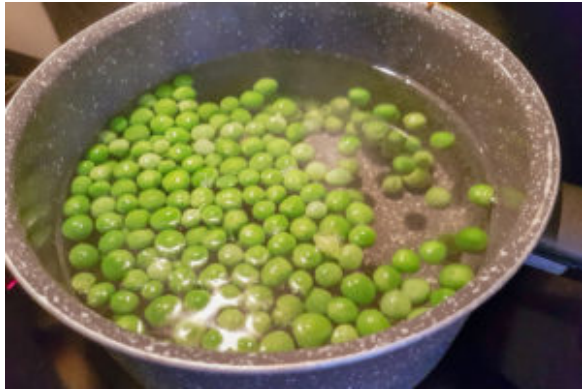
Cuisez les petits pois