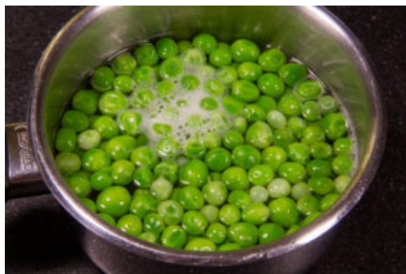
Cuisez les petits pois