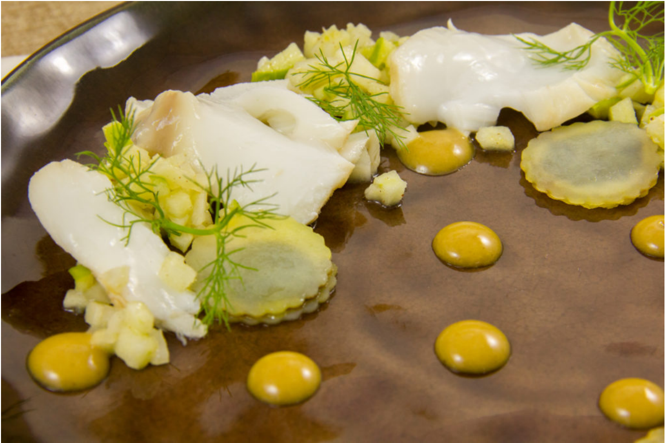
Pétales de cabillaud basse température, fenouil , pommes et ravioles de pommes de terre à l'ail noir