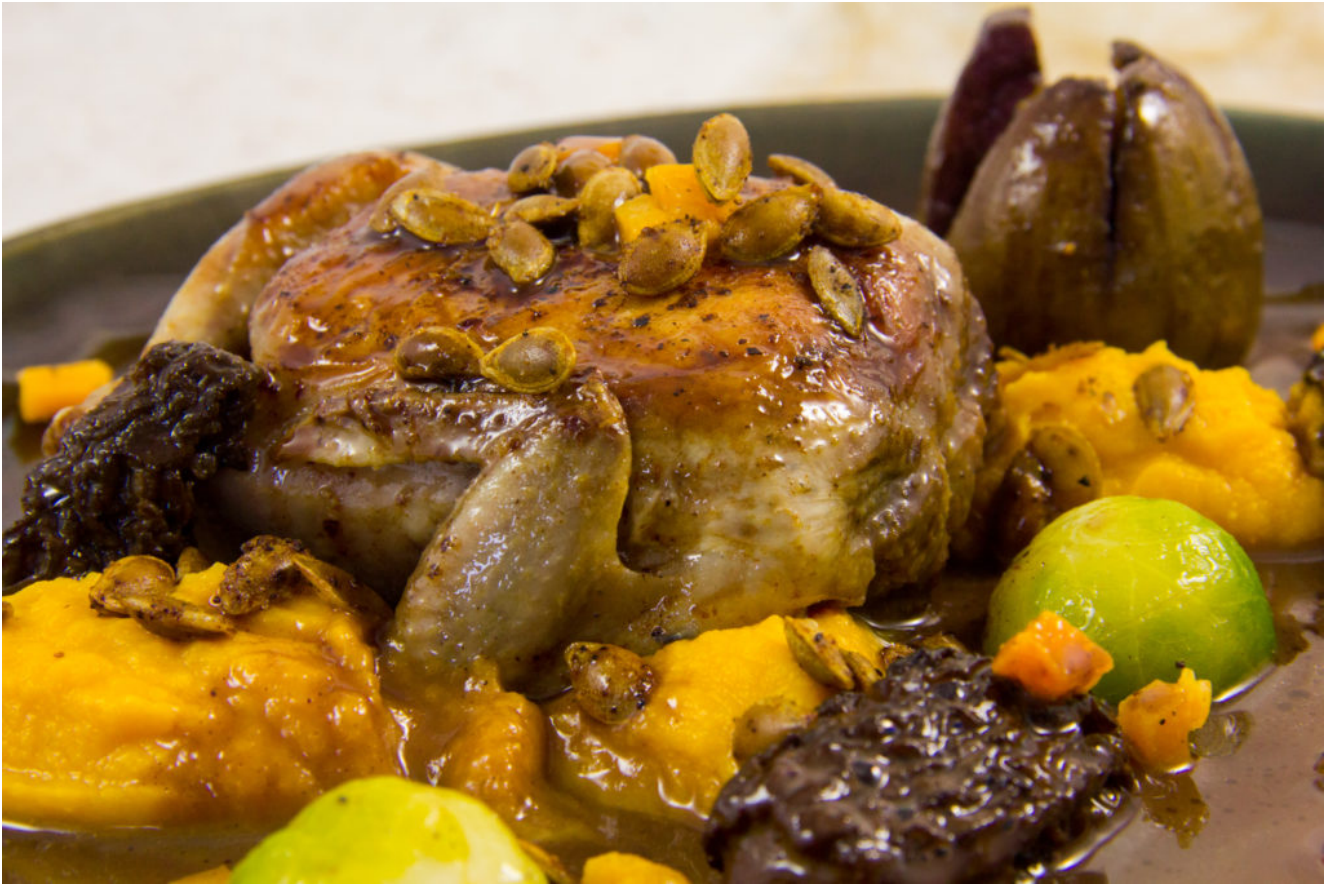
Caille basse température, butternut, morille, sauce au vin et aux figes