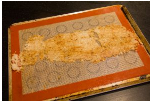
Chips de riz