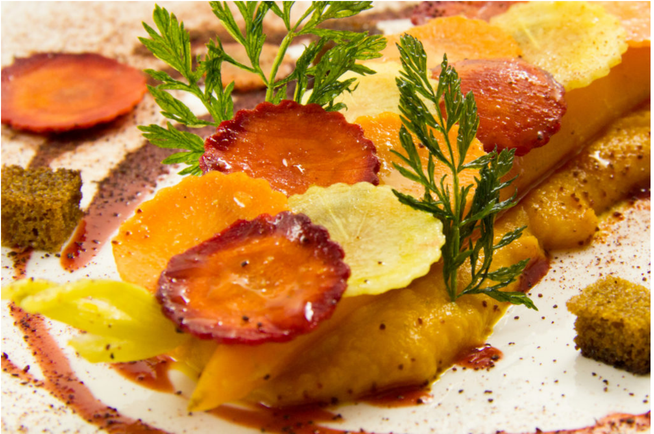
Délice tout carotte, coulis de betterave à l'orange