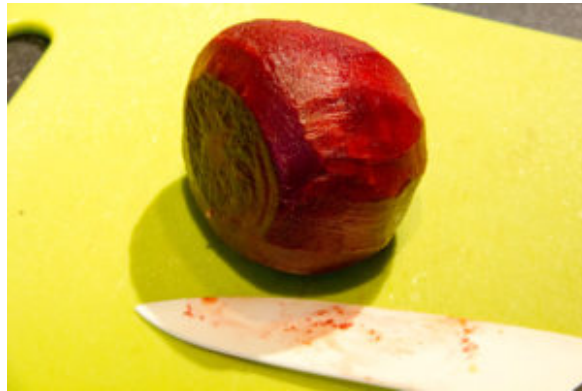
Épluchez la betterave