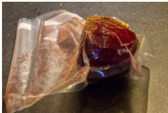
Mettre la betterave sous vide