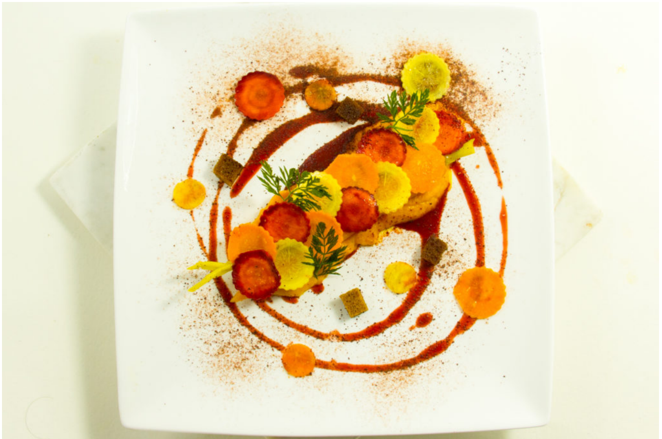
Délice tout carotte, coulis de betterave à l'orange