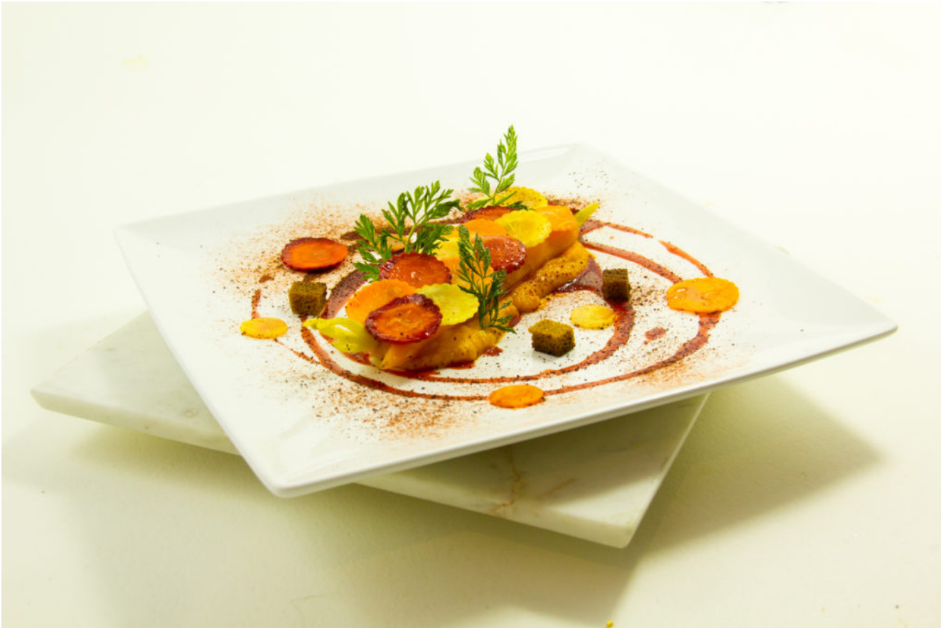
Délice tout carotte, coulis de betterave à l'orange