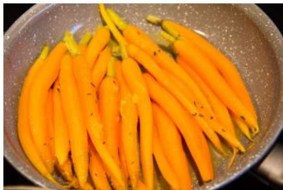
Cuisson des carottes