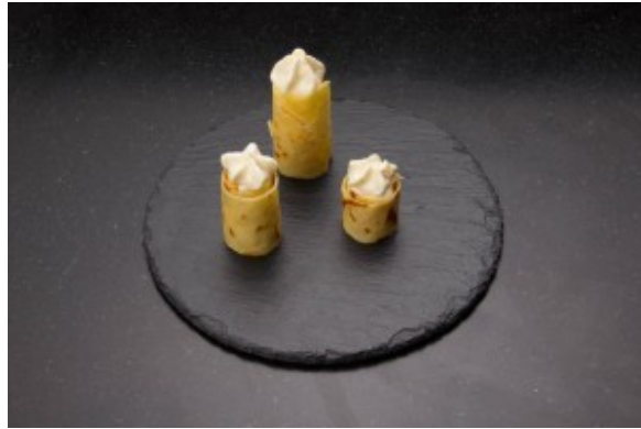
Les remplir de crème