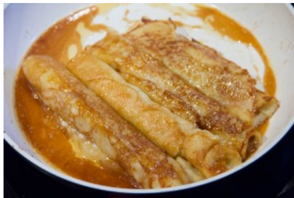
Caramélisez les crêpes