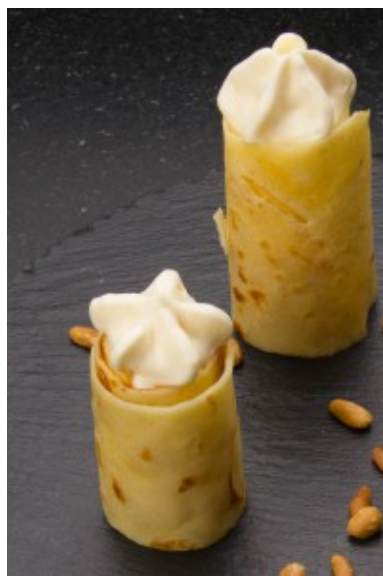
Crêpes, crème Délice au miel et pignons