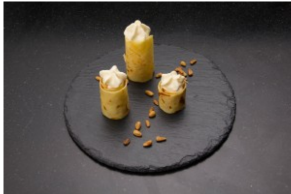
Parsemez de pignons