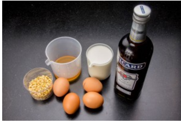
Ingrédients crème Délice