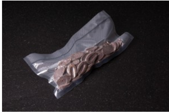
Sachet de chocolat sous vide