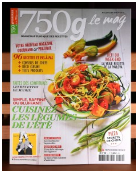
750 g le mag