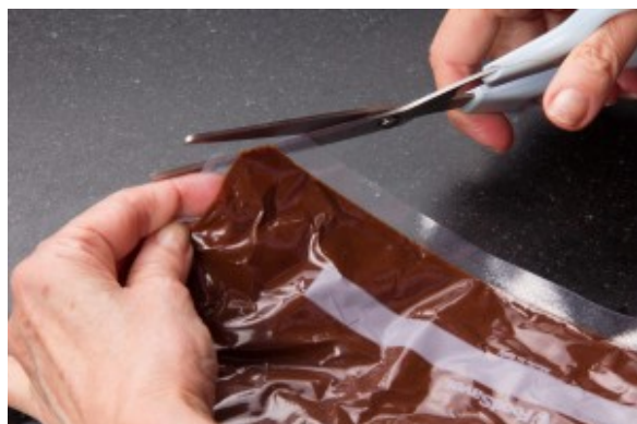
Coupez le coin du sachet