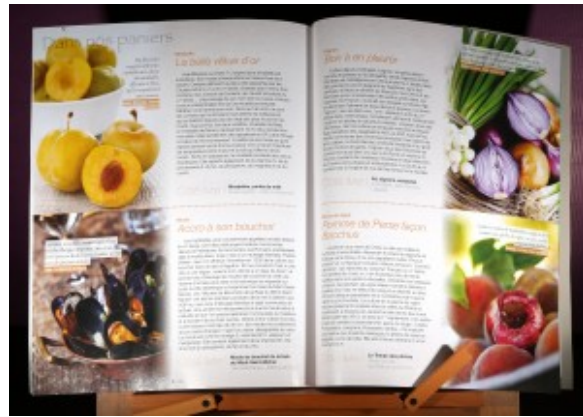
Nourrir « Dans nos paniers »