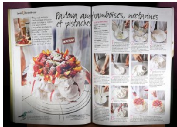
750 g le mag recette pas à pas