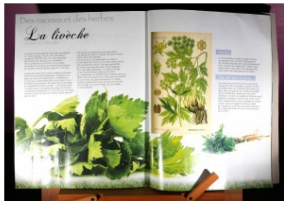
Nourrir « Des racines et des herbes »