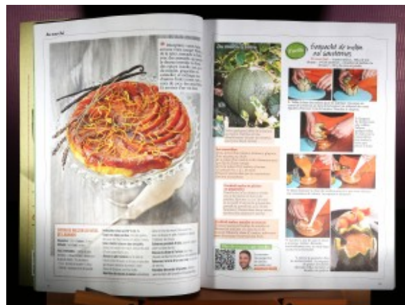
750 g le mag recette flash code