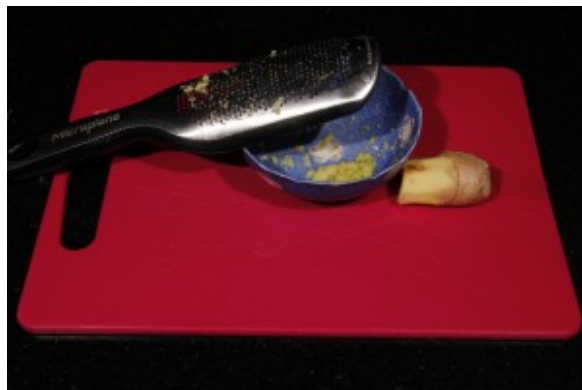
Râpez le gingembre