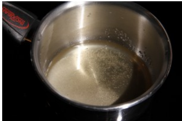
Chauffez à feu doux