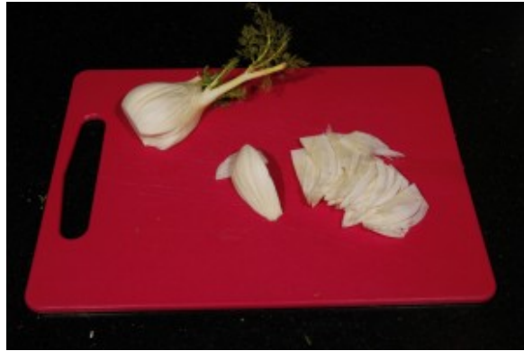
Coupez le fenouil