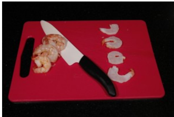
Coupez chaque gambas en deux