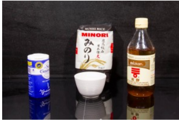
Ingrédients du riz