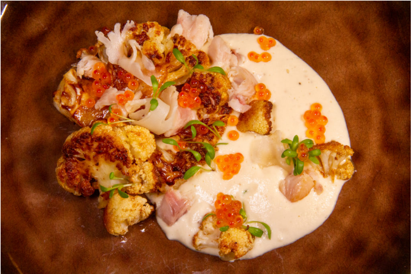
Chou-fleur rôti et sa crème à l'anguille fumée