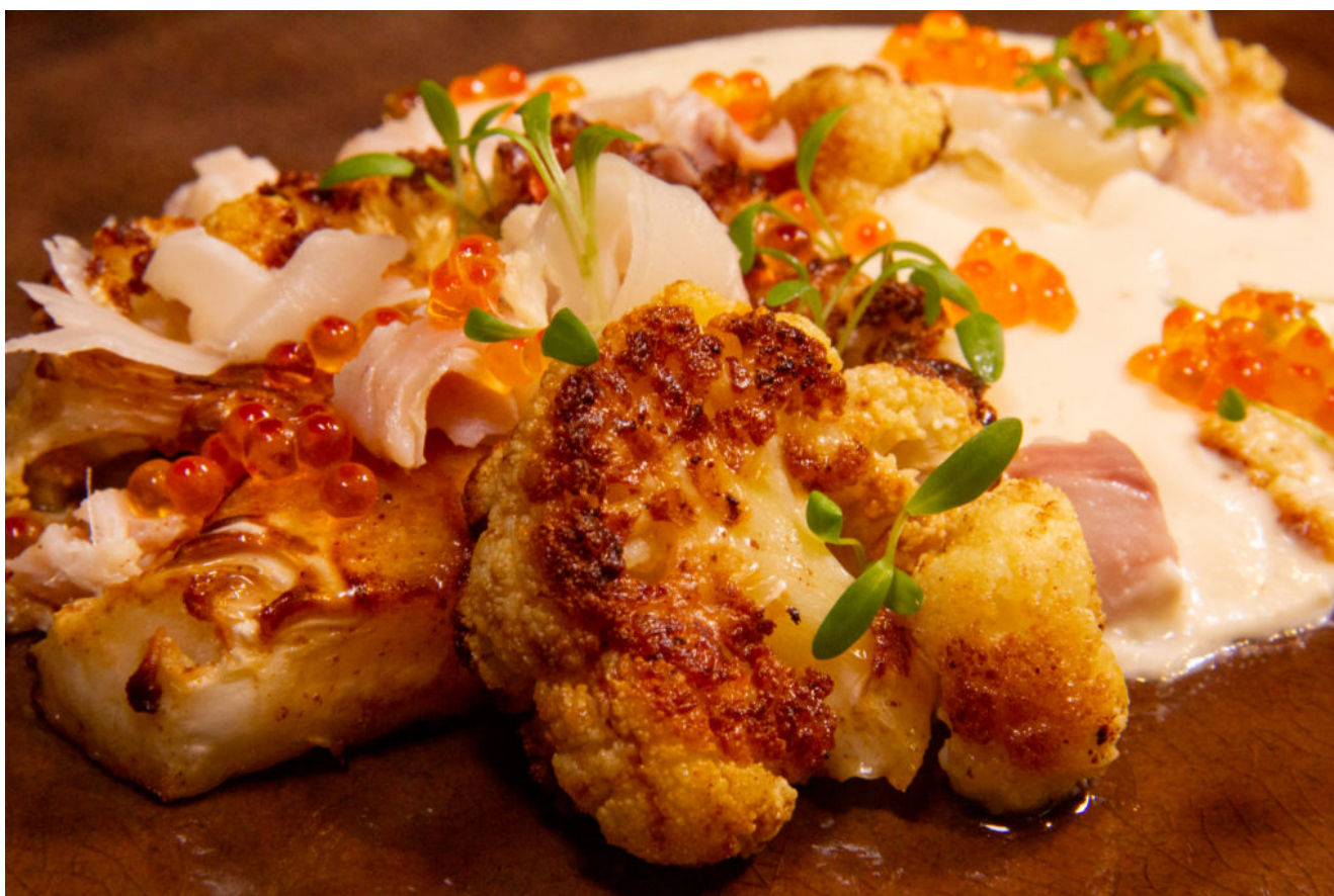
Chou-fleur rôti et sa crème à l'anguille fumée

Cette recette m'a fait de l'œil et je m'en suis inspirée pour vous proposer cette déclinaison de chou-fleur à l'anguille fumée.