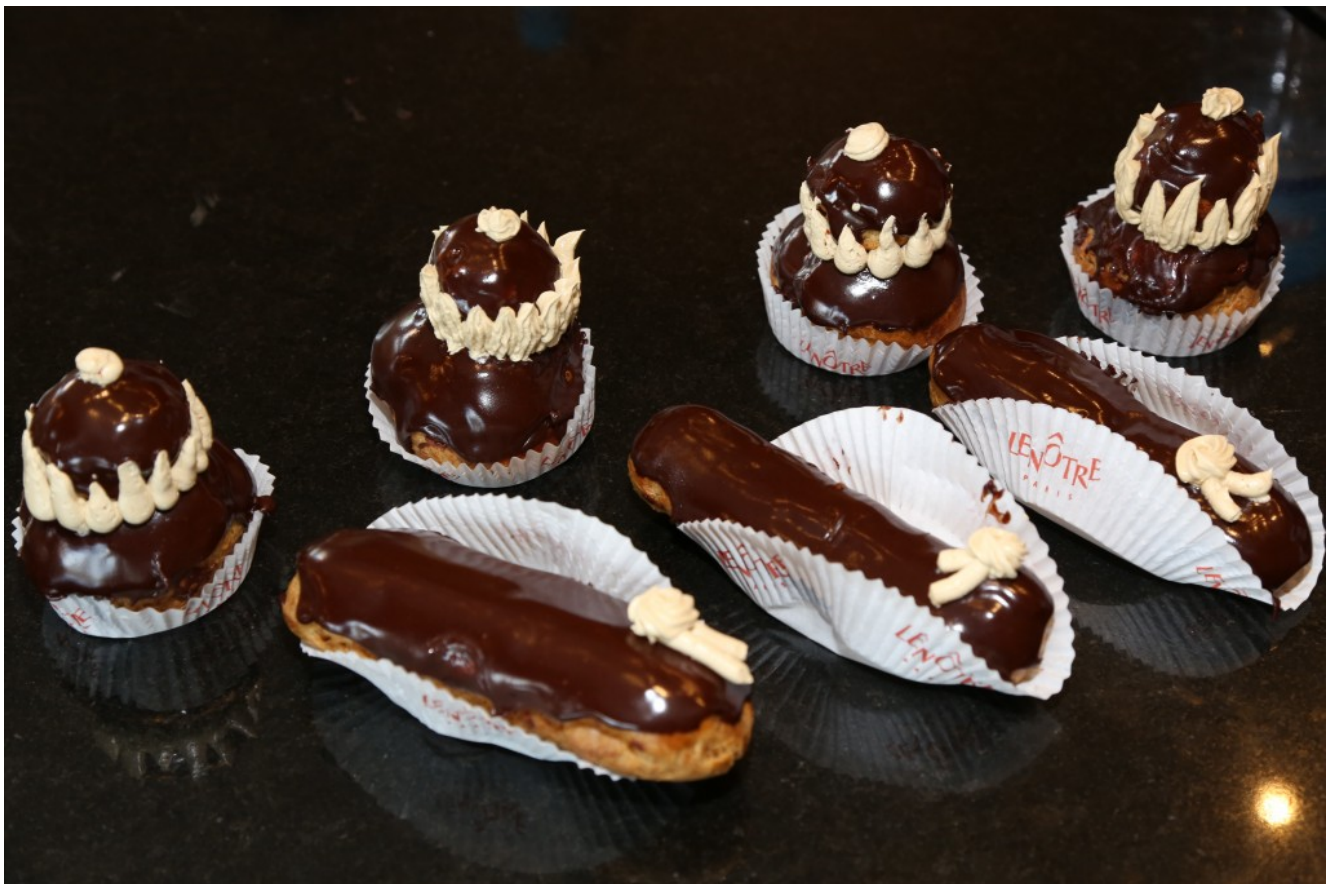
Chouquettes, éclairs et religieuses au chocolat

Depuis son succès ne s'est jamais démenti au point que de nombreux chefs pâtisseries de renom comme Christophe Adam ou Philippe Conticini arrivent encore à les magnifier avec de nouvelles et sublimes créations.