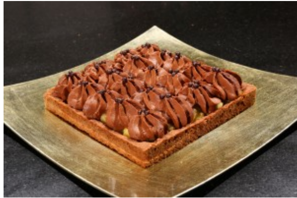
Chocananas sans la feuille en chocolat