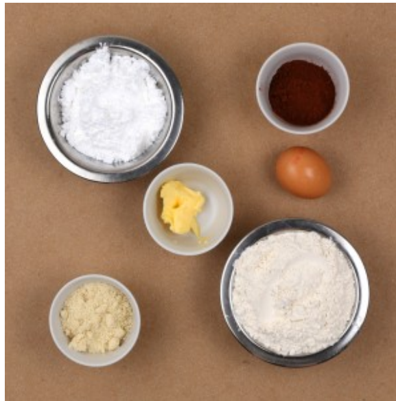
Ingrédient pâte au chocolat