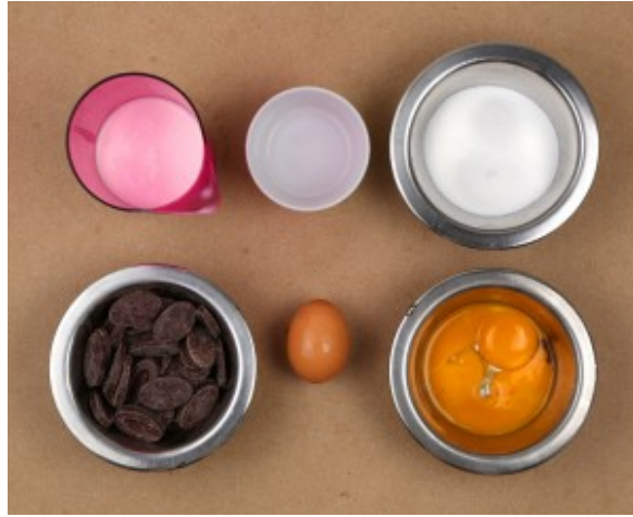
Ingrédients pour la mousse