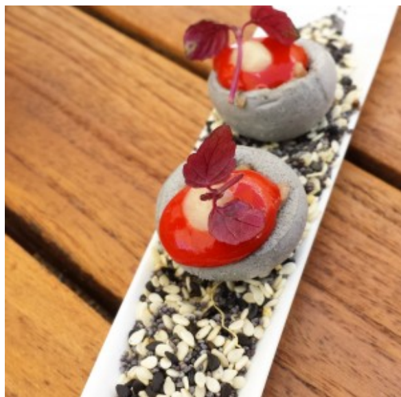
Mise en bouche

Puis une meringue au sésame, mousse de poivron et chorizo.