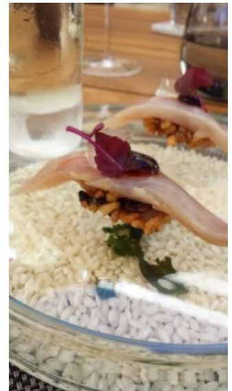
Suchis au riz soufflé