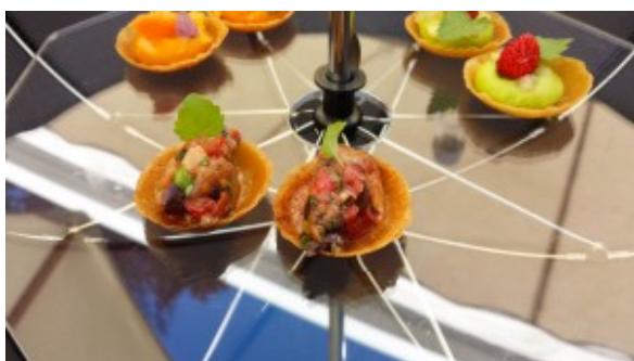
Mise en bouche

Commençons par les amuse-bouches: différentes petites tartelettes (carottes oranges, petite ratatouille aux anchois, petits pois menthe)