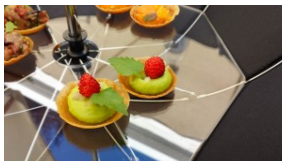
Mise en bouche