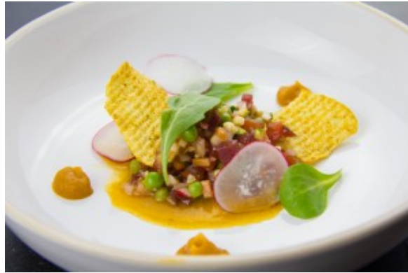
Croquant de tartare végétal et sa vinaigrette tomatée