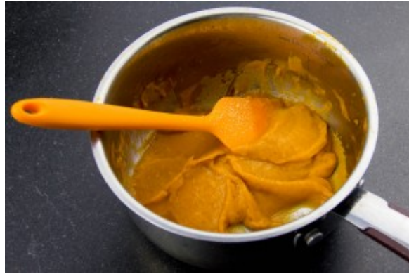
Réduire la sauce tomate