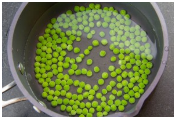
Cuire les petits pois deux minutes dans l'eau frémissante