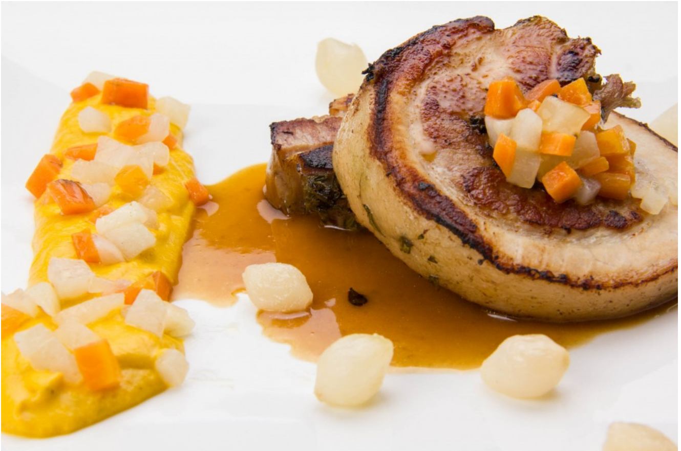
Cochon de 8 heures basse température

Pour plus de renseignements sur la cuisine sous vide basse température cliquez ici .