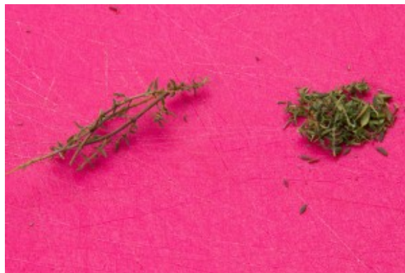
Effeuillez le thym