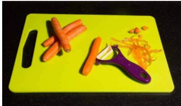
Épluchez les carottes