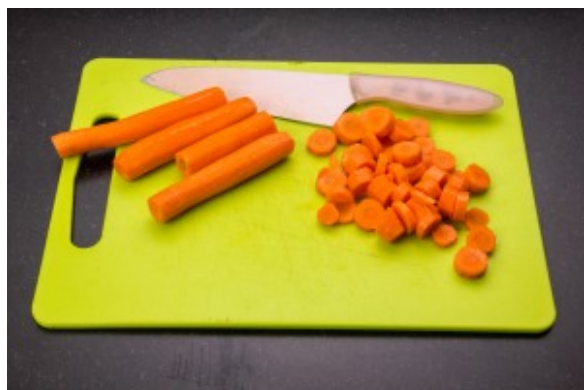
Coupez les carottes en