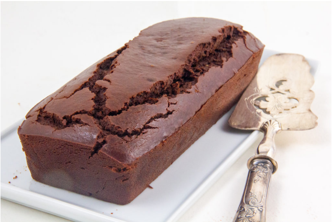
Gâteau au chocolat sans œufs ni produits laitiers