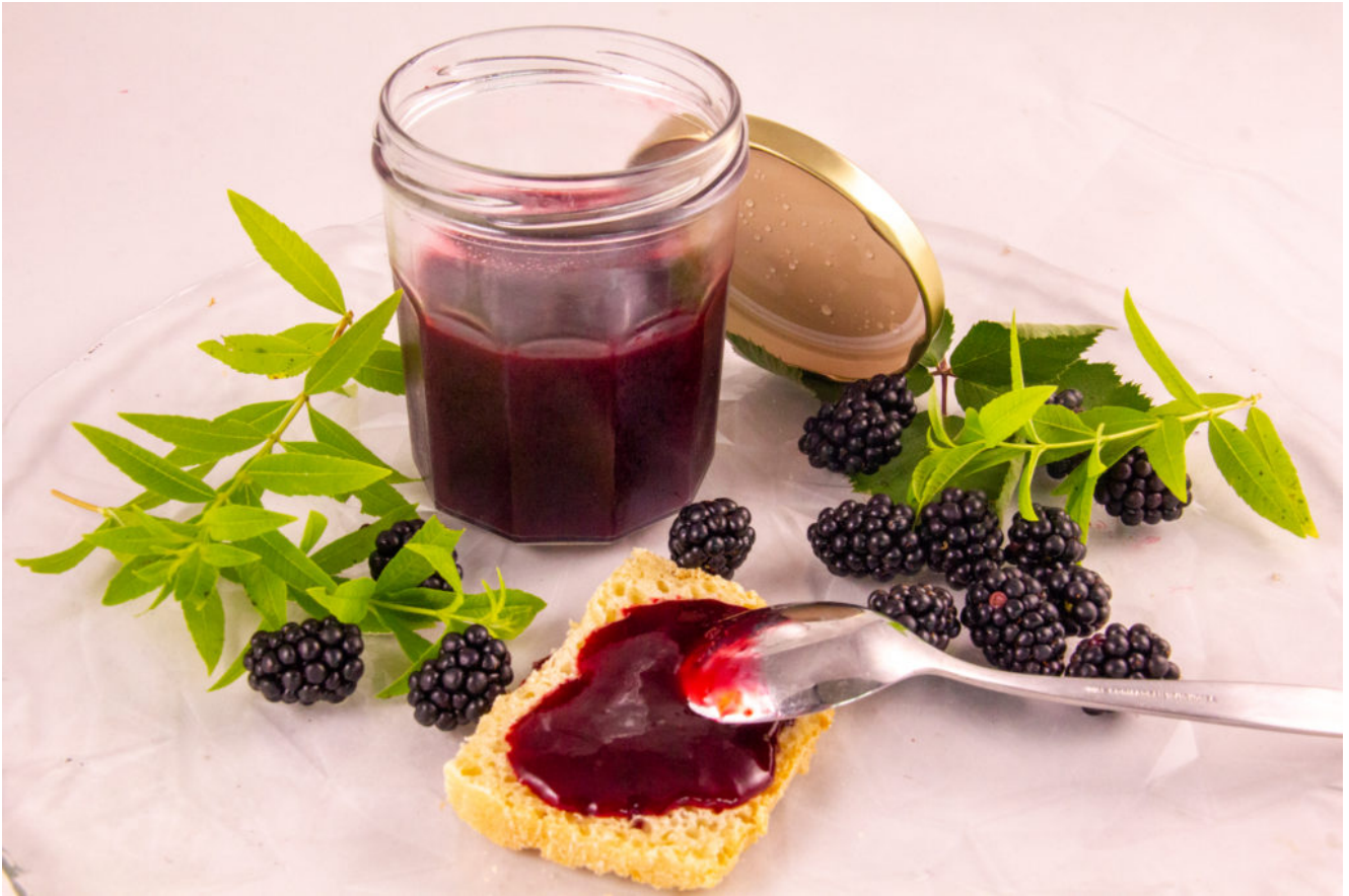
Confitures de mûres et verveine