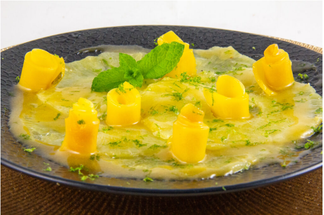
Carpaccio surprise d'ananas basse température (recette sous vide basse température)