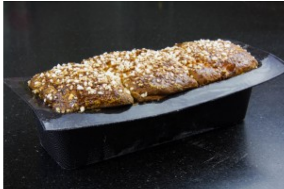
A la sortie du four...