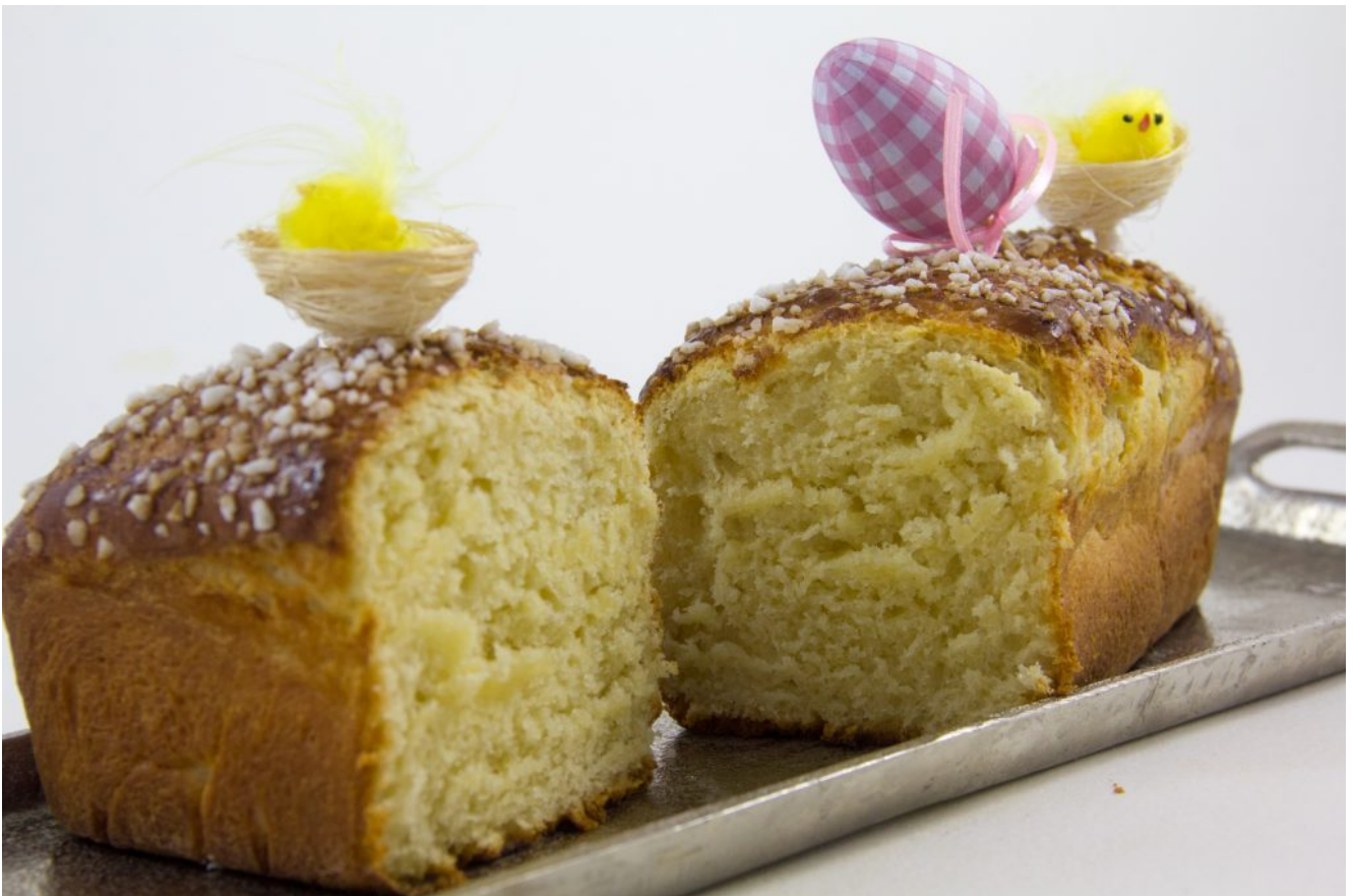
Comment faire une bonne brioche