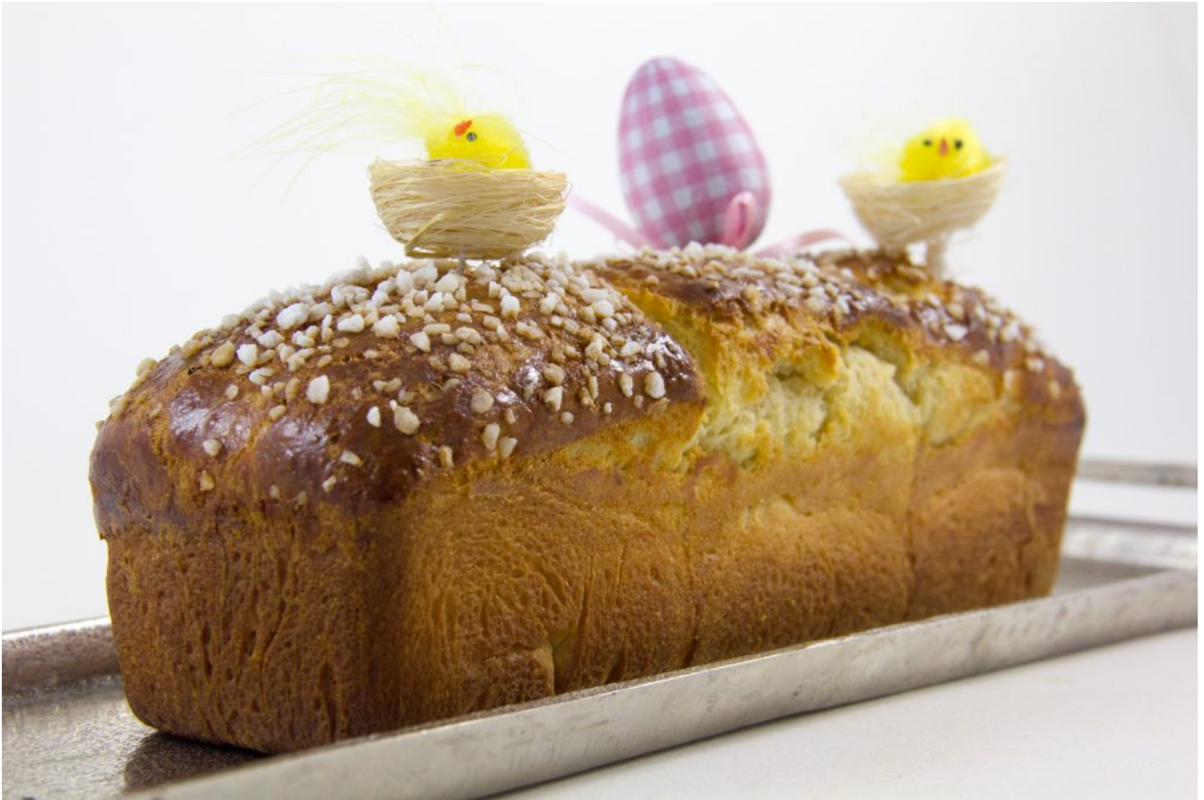
Comment faire une bonne brioche