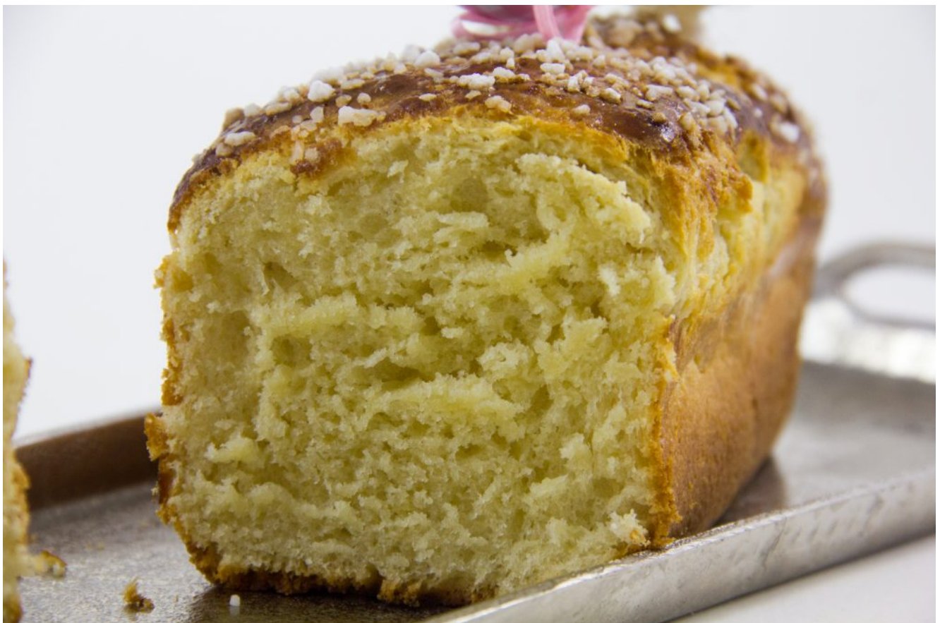
Comment faire une bonne brioche