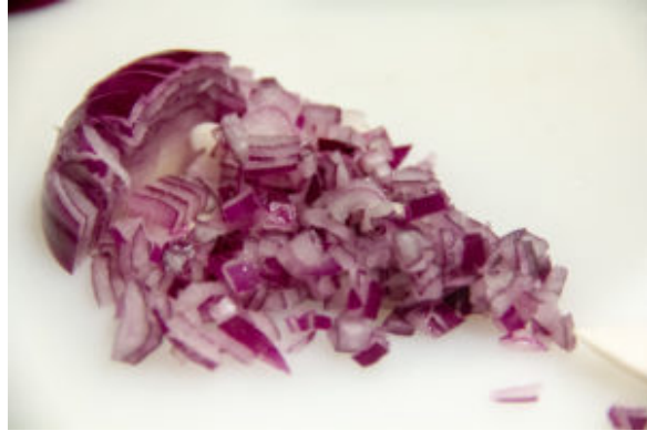
Brunoise d'oignon rouge