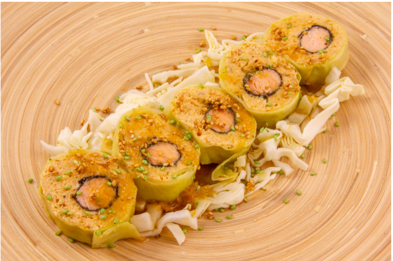
Maki de saumon à ma façon