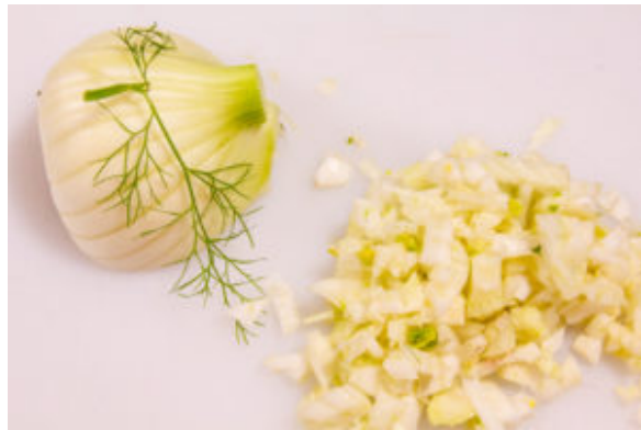
Ciselez les oignons finement ainsi que le fenouil.