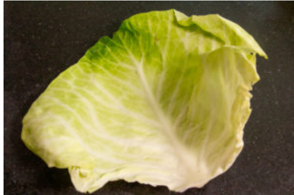
Prélevez les feuilles de chou