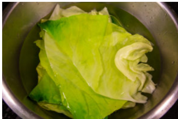
Faites blanchir les feuilles de chou