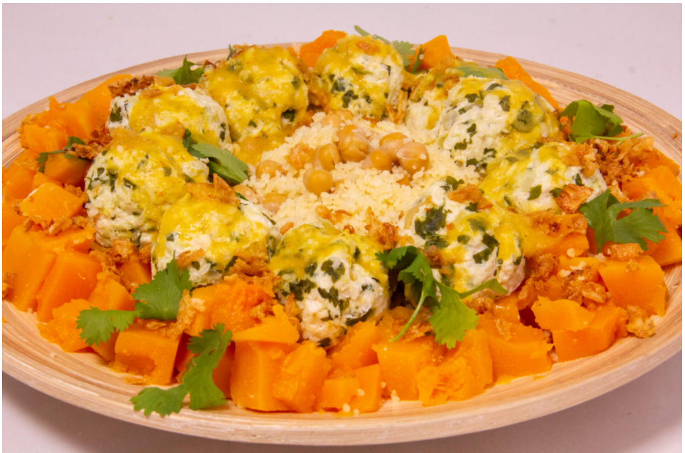
Bouchées de volaille, butternut , citron confit (recette menu

Un menu comme je les aime au Thermomix où tout cuit en même temps , sans surveillance, afin de réaliser un bon repas sain et équilibré. Et retrouvez la recette complète tout en vidéo en fin d'article.