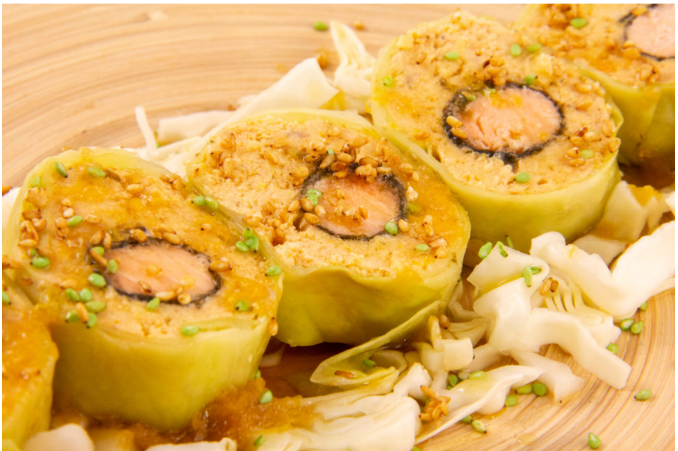
Maki de saumon à ma façon

Pour la version Thermomix de la recette CLIQUEZ ICI