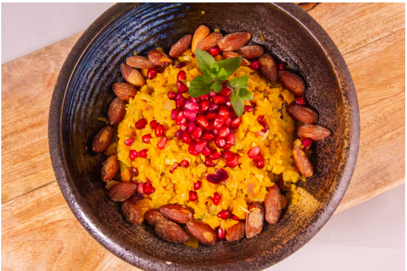
Salade estivale de carotte à l'orientale

Pour la version Thermomix de la recette cliquez ici .