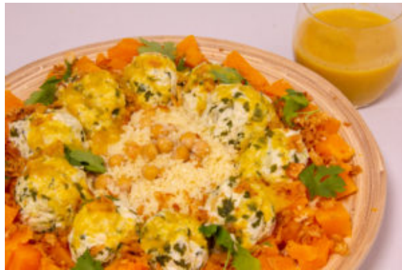
Bouchées de volaille, butternut , citron confit (recette menu Thermomix en vidéo)