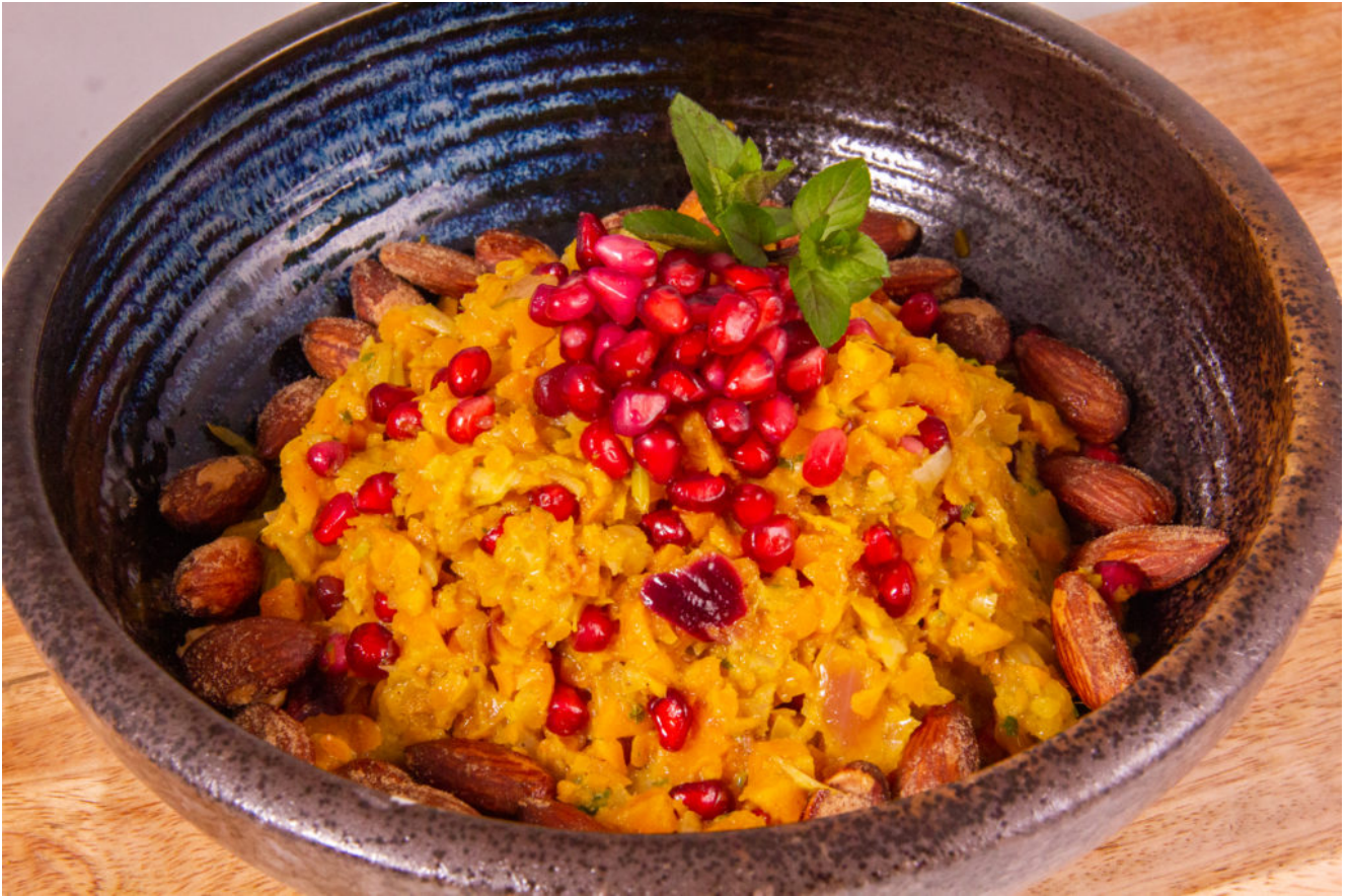
Salade estivale de carotte à l'orientale