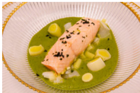
Saumon au vert (recette Thermomix en vidéo)