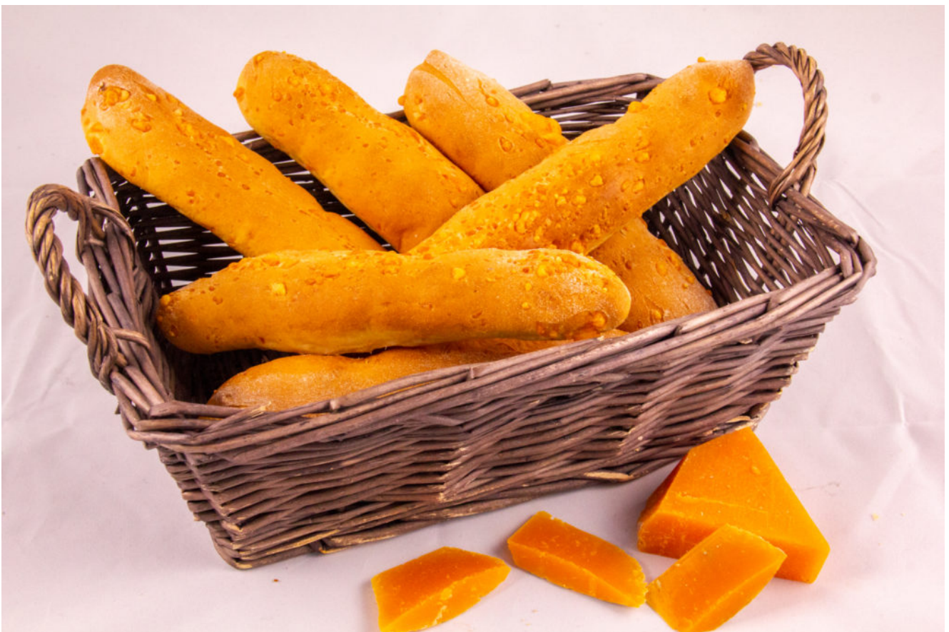
Ficelles à la mimolette (recette Thermomix)

J'aime beaucoup les petites ficelles à la mimolette que je trouve chez mon boulanger. J'ai donc voulu les réaliser maison et je vous en livre la recette. Et retrouvez l'adaptation de cette recette pour votre Thermomix en cliquant ici !