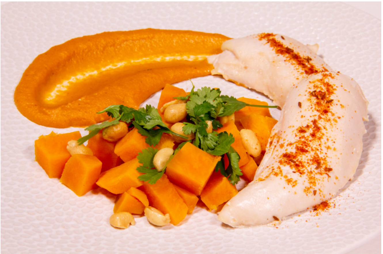
Poulet Saté, cacahuètes (menu recette Thermomix en vidéo)

Un plat d'inspiration asiatique et surtout réalisé en 30 minutes sans rien surveiller avec votre Thermomix! Et suivez la recette en vidéo en fin d'article pour encore plus de facilité!