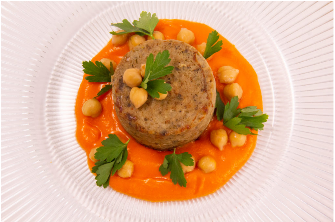
Flans d'aubergine, pois chiches et tomate (recette végétarienne menu Thermomix)