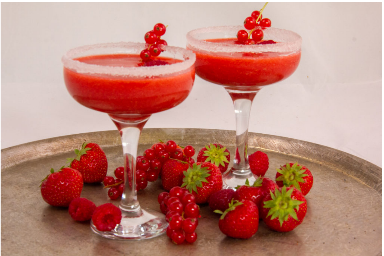
Red Margarita (cocktail)

Pour la recette adaptée au Thermomix cliquez ici .