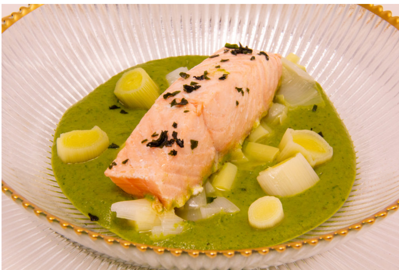
Saumon au vert (recette Thermomix en vidéo)

Et suivez la recette en intégralité en vidéo en fin d'article!