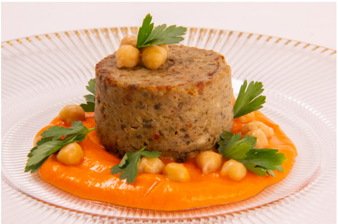
Flans d'aubergine, pois chiches et tomate (recette

Vous trouverez la vidéo de cette recette en fin d'article.