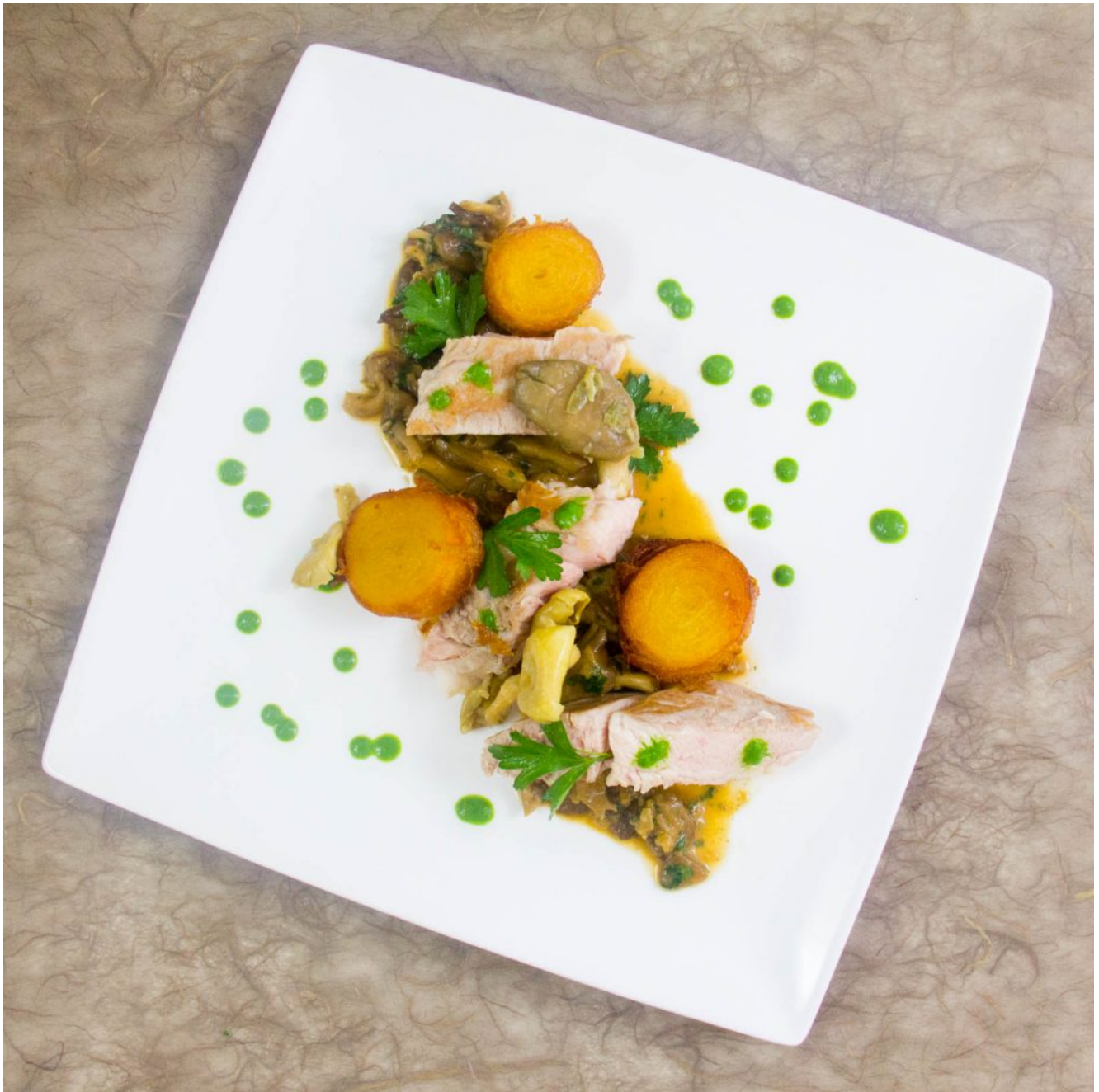
Côte de veau cuite basse température, sauce forestière et pommes de terre croustillantes (Les carnets de Julie)