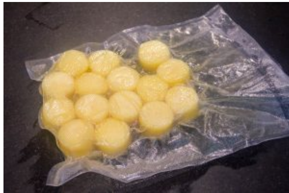
Palets de pommes de terre sous vide