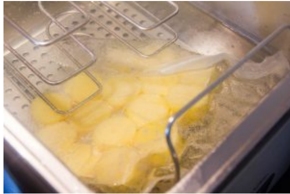
Cuire les pommes de terre sous vide