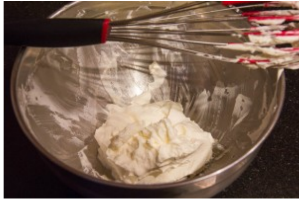
Battez la crème au fouet