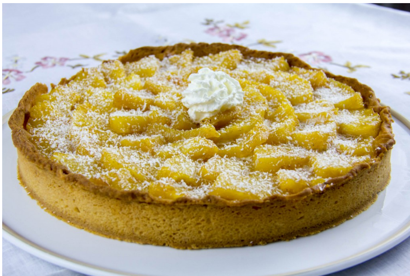
Tarte à l'ananas caramélisée