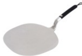
Spatule à pizza

Et maintenant on se pose: une bonne tasse de thé et une part de tarte bien méritée! Pour les grands gourmands servez-la avec un peu de chantilly.