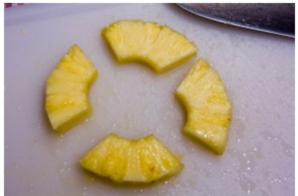
Coupez les tranches d'ananas en quatre