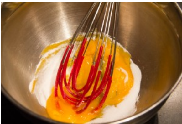
Fouettez les jaunes et le sucre