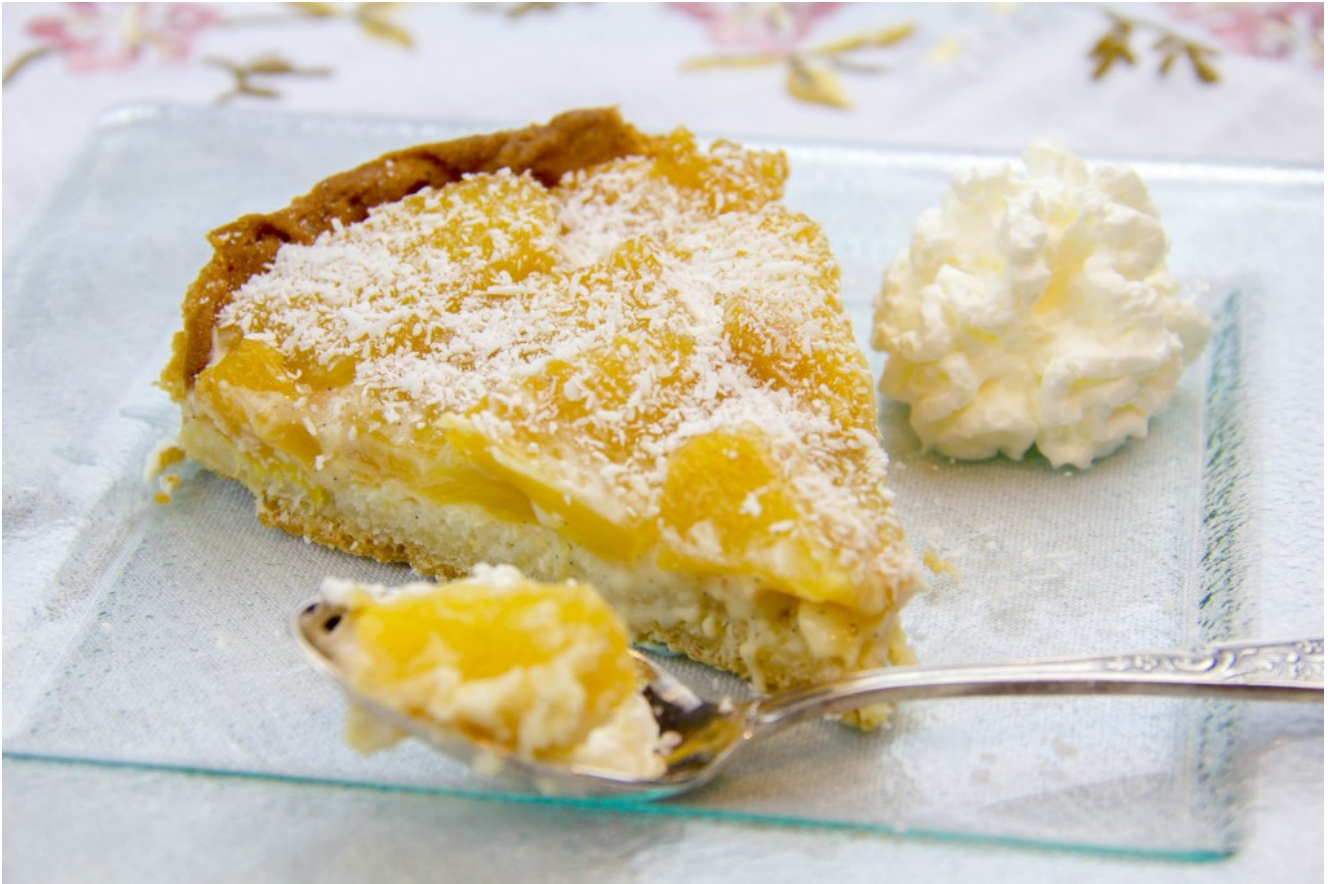
Tarte à l'ananas caramélisée