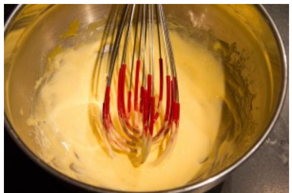
Le mélange jaune et sucre doit blanchir