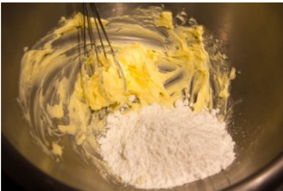
Mélangez le beurre mou et le sucre vivement au fouet