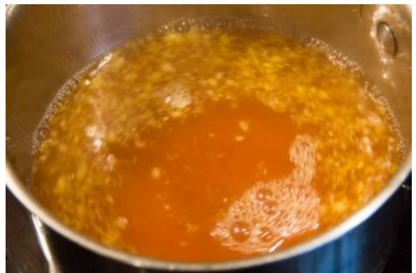
Décuire le caramel avec l'eau , le rhum et la purée de fruits