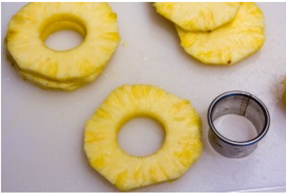
ôtez le cœur de l'ananas