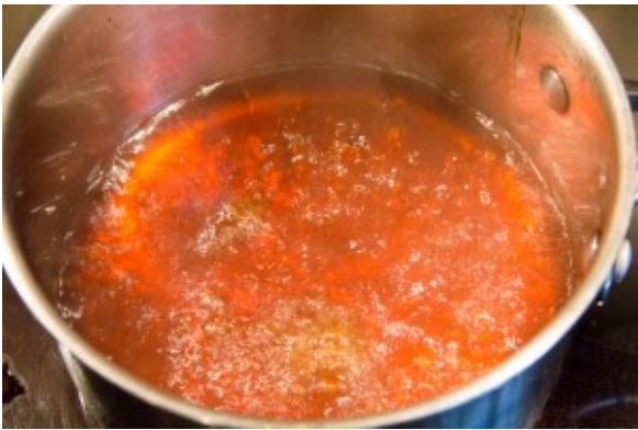
Réalisez un caramel