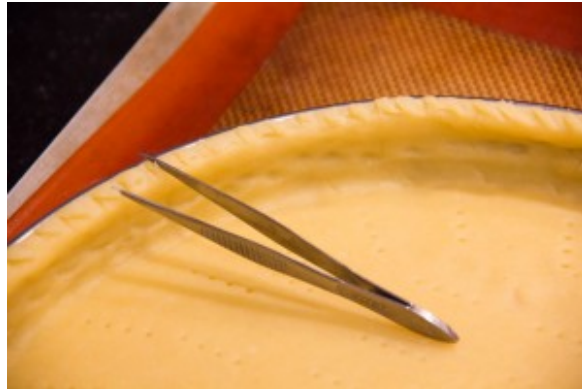
Chiqueter les bords