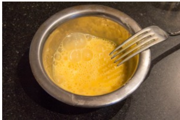
Battez les œufs rapidement