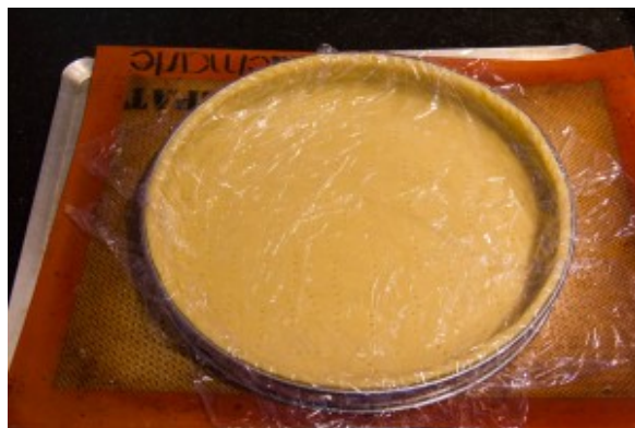
filmez la pâte