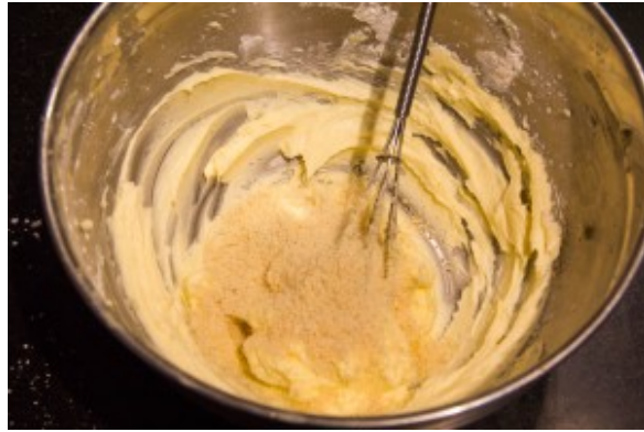
Ajoutez la poudre d'amande