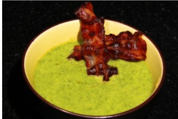
Crème de courgette et cerfeuil, chips de lard