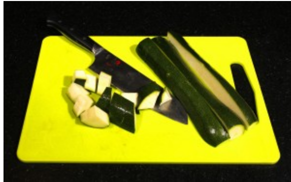
Détaillez les courgettes en gros morceaux