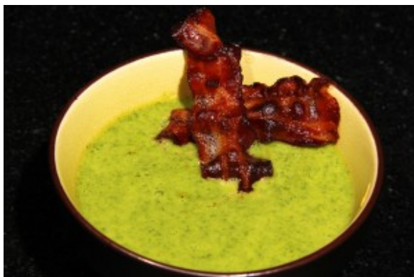
Crème de courgette et cerfeuil, chips de lard

étonnera vos invités. Le lard amène le côté croustillant que nous aimons tous retrouver dans un plat.