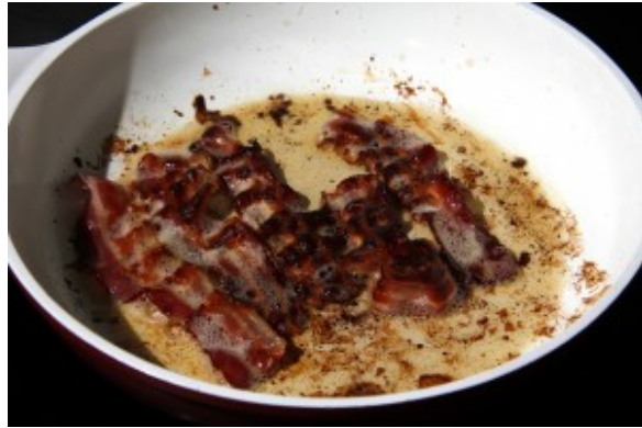
Faire dorer les tranches de lard