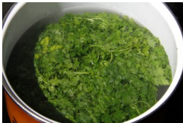
Blanchir le cerfeuil.