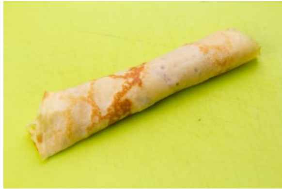
Roulez les crêpes