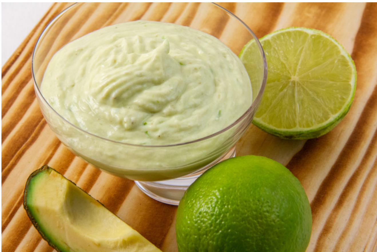
Mayonnaise à l'avocat

Pour la recette au Thermomix cliquez ici