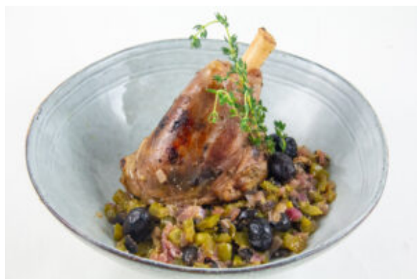
Souris d'agneau basse température et sa poêlée de poivrons verts aux olives

En plat: Souris d'agneau basse température et sa poêlée de poivrons verts aux olives (recette basse température) Pour la recette cliquez ici