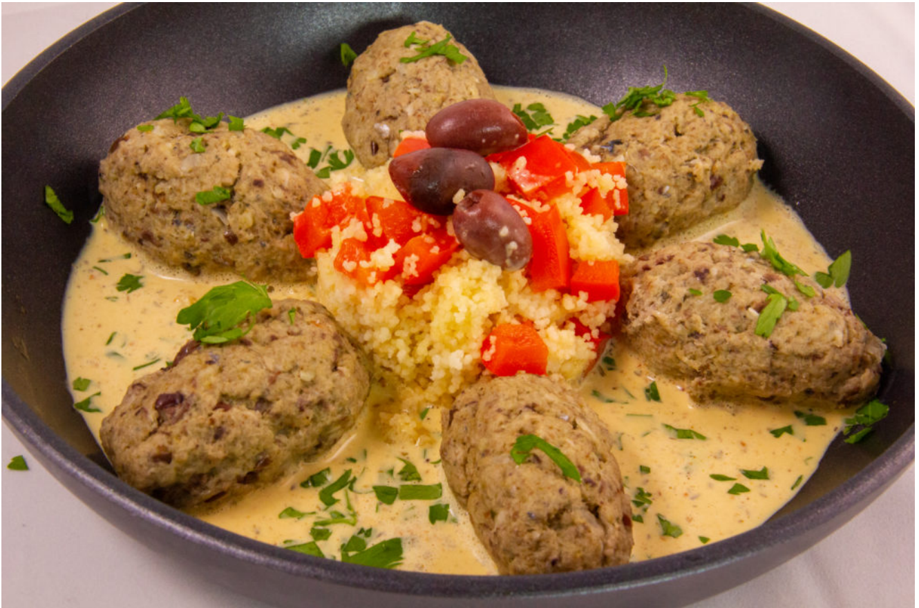
Keftas de la mer sauce citron (recette menu poisson Thermomix)