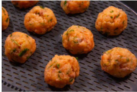
Façonnez les boulettes de saumon