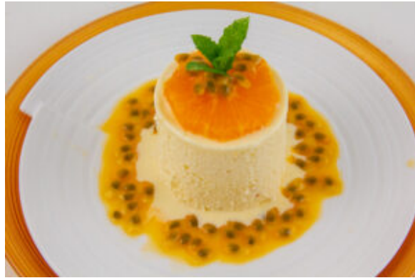
Soufflés glacés à la mandarine

Enfin d'autres suggestions que vous pourrez trouver sur le blog! Je vous ai fait une sélection gourmande de plats festifs. Pour accéder aux recettes suivantes cliquez sur le nom de la recette: