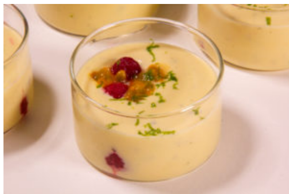
Bavaoais passion framboise (recette Thermomix)