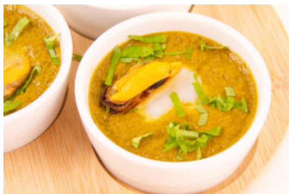
Royale de moule et céleri aux Saint Jacques

En plat: Souris d'agneau basse température et sa poêlée de poivrons verts aux olives (recette basse température) Pour la recette cliquez ici