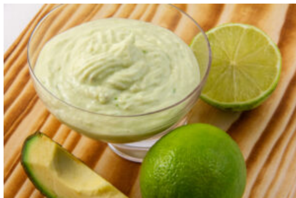
Mayonnaise à l'avocat (