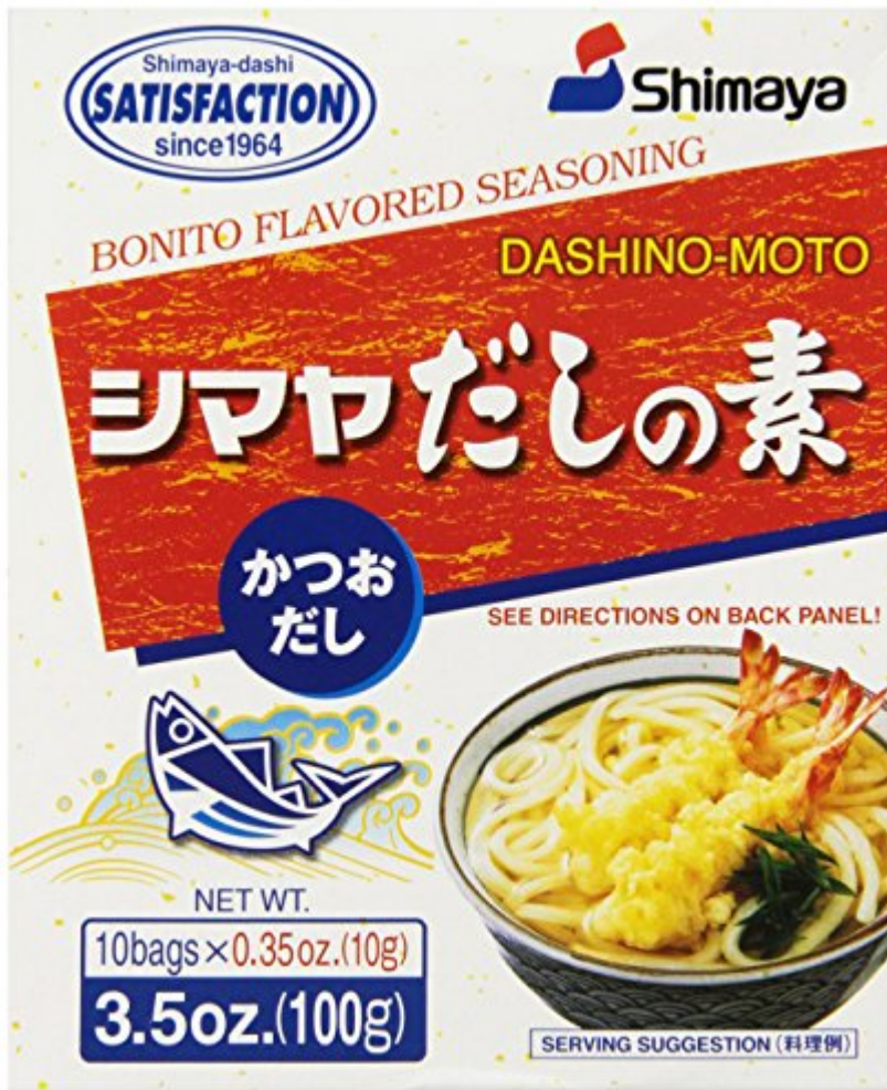
Shimaya Dashi S-10, 3.5-Ounce Units (Pack of 10)