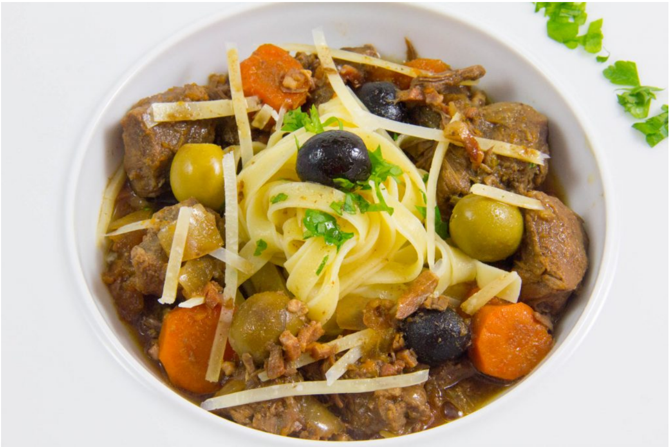
Daube provençale en cocotte lutée de Philippe Etchebest