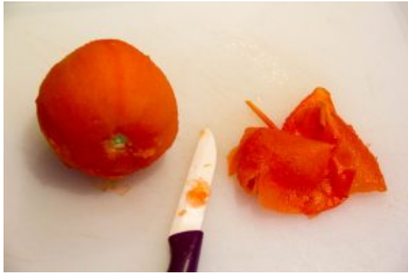
Pelez les tomates