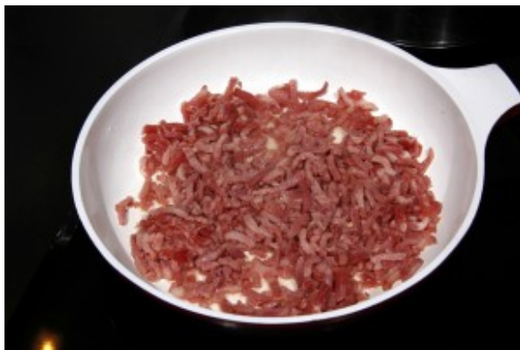
Faire revenir les lardons.