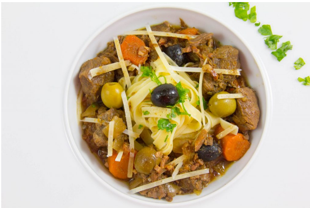
Daube provençale en cocotte lutée de Philippe Etchebest

Un bon petit plat d'hiver concocté par un grand chef et qui plus est super facile à faire! Sautez sur vos cocottes et mitonnez cette délicieuse daube provençale pour régaler toute votre famille! On peut remercier le chef Philippe Etchebest pour cette délicieuse daube que j'avais remarquée dans une de ses émissions « Cauchemar en cuisine ».