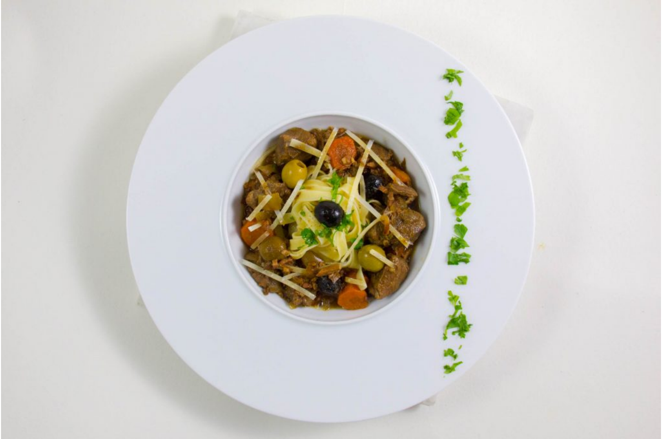
Daube provençale en cocotte lutée de Philippe Etchebest

Et c'est fini... Cette délicieuse daube se sert soit avec des pommes de terre ou avec des pâtes fraîches. Ajoutez un peu de persil et des petits copeaux de parmesan.