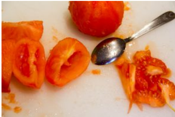
Ôtez les pépins des tomates