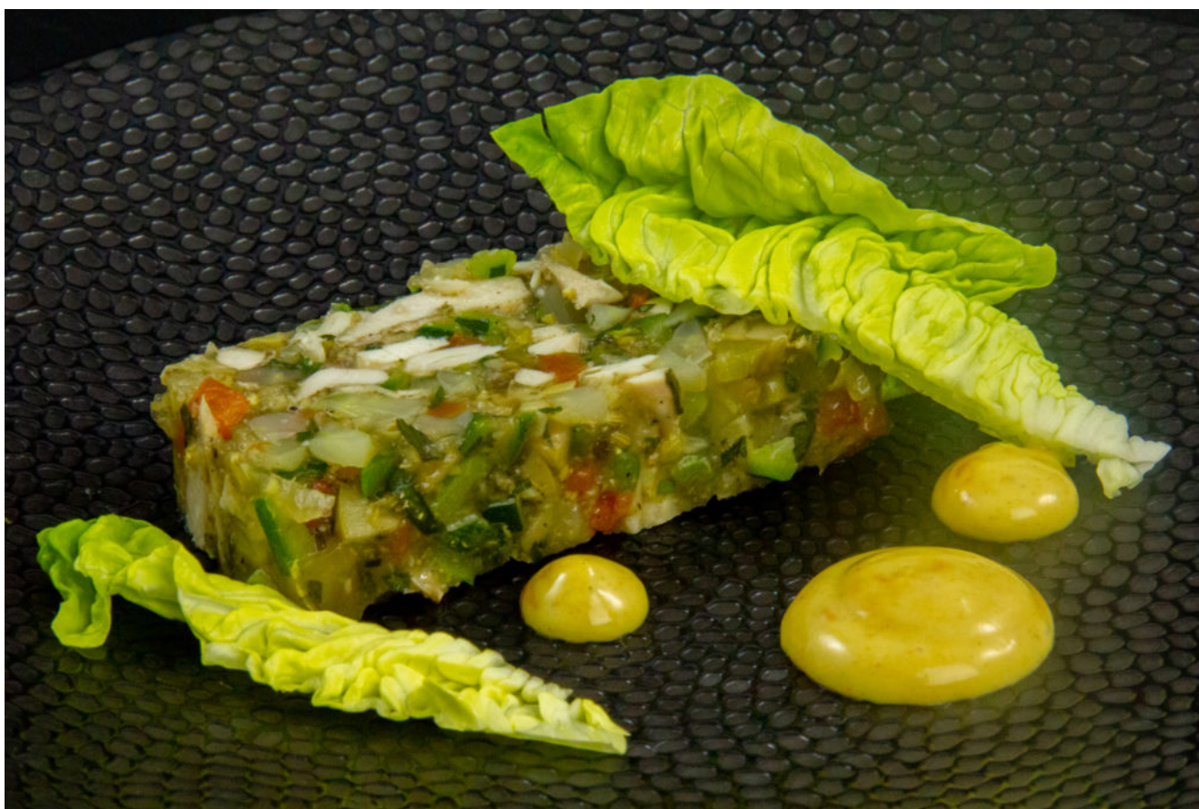
Volaille en gelée et mayonnaise au fenouil