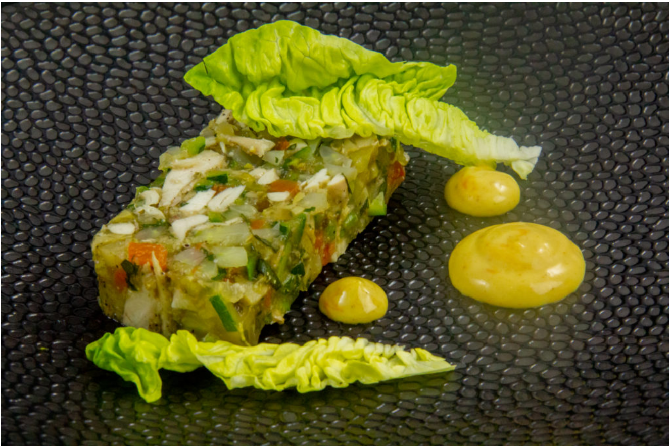
Volaille en gelée et mayonnaise au fenouil