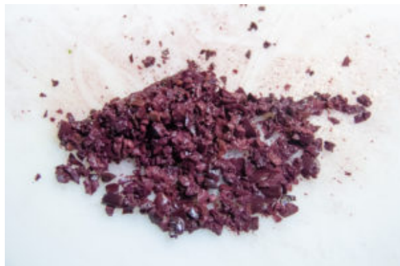
Dénoyautez les olives et coupez-les aussi en fine brunoise