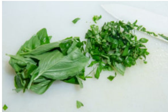
Ciselez les feuilles de basilic