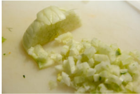
Ciselez le fenouil