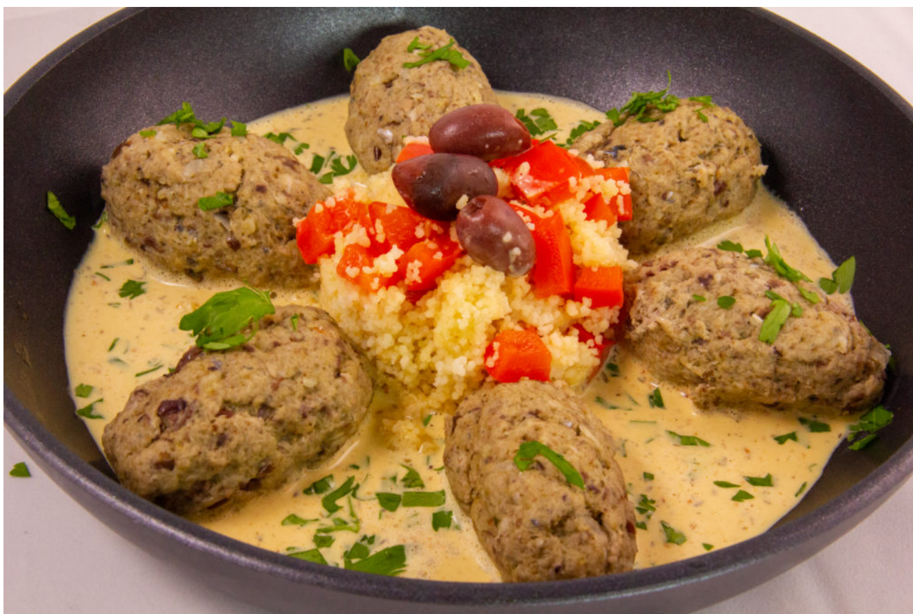
Keftas de la mer sauce citron (recette menu poisson Thermomix)