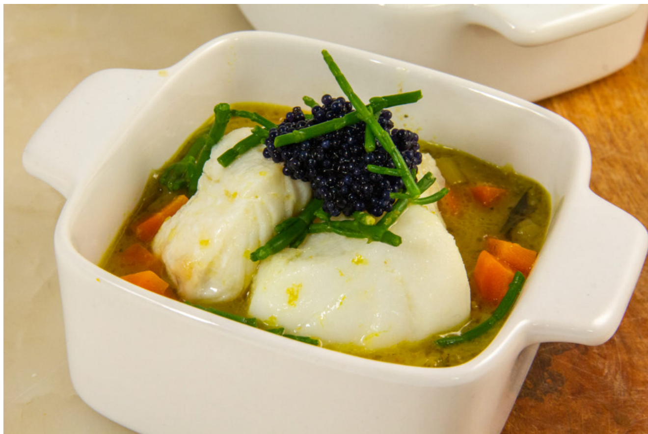
Cassolette de la mer (recette menu tous en un Thermomix)

Le Thermomix est le robot extraordinaire de votre cuisine et ce que j'apprécie particulièrement ce sont les menus all in one que vous pouvez réaliser à votre envie: tout cuit en même temps pour un résultat optimum, sans surveillance et beaucoup de gourmandise à la dégustation. Alors à vos Thermomix et régalez-vous avec cette Cassolette de la mer!