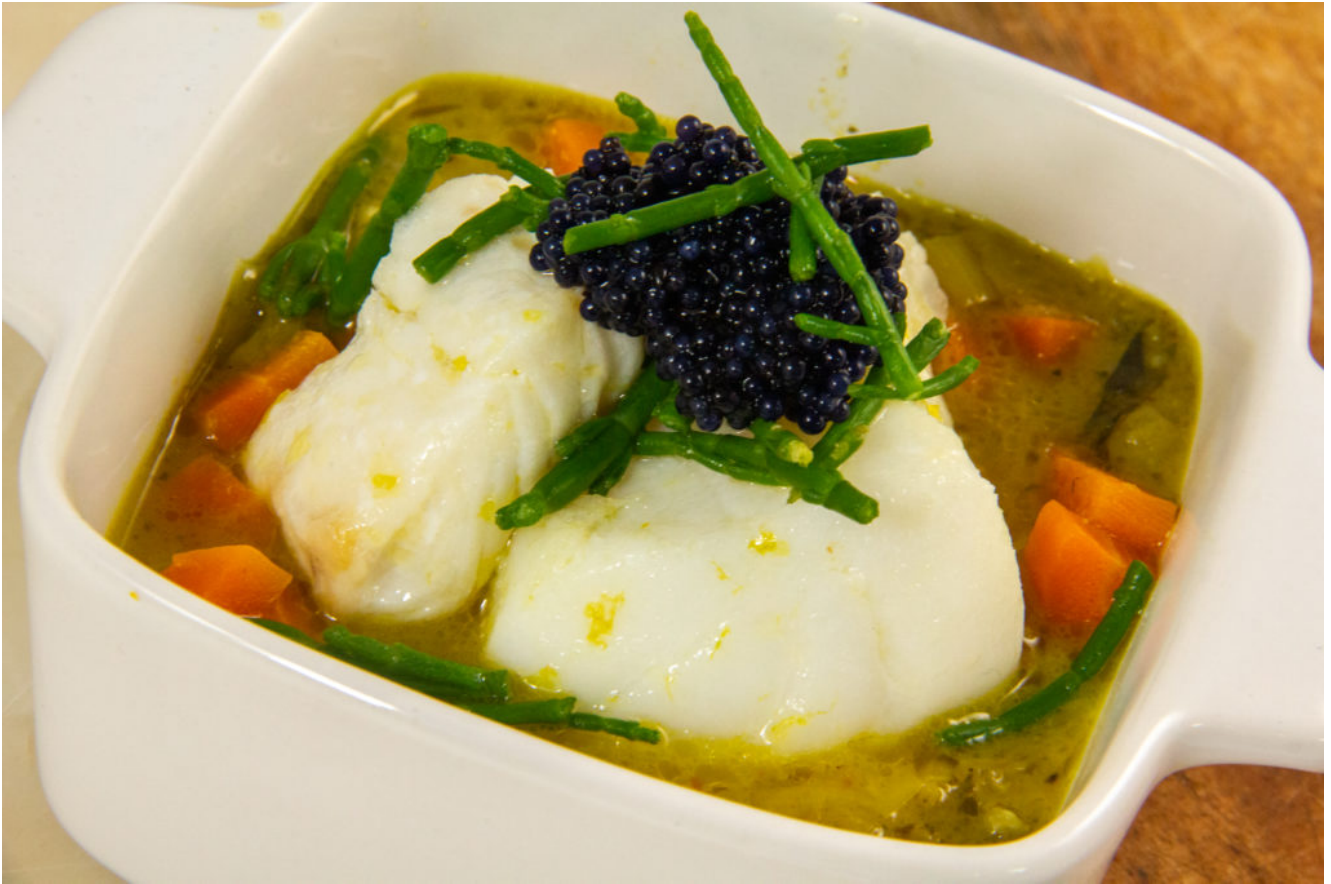
Cassolette de la mer ( recette menu tous en un Thermomix)