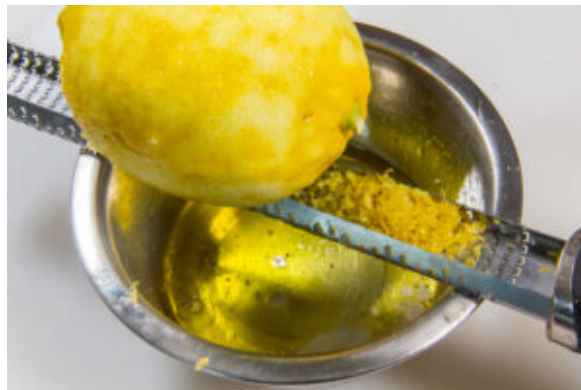
Zestez un citron