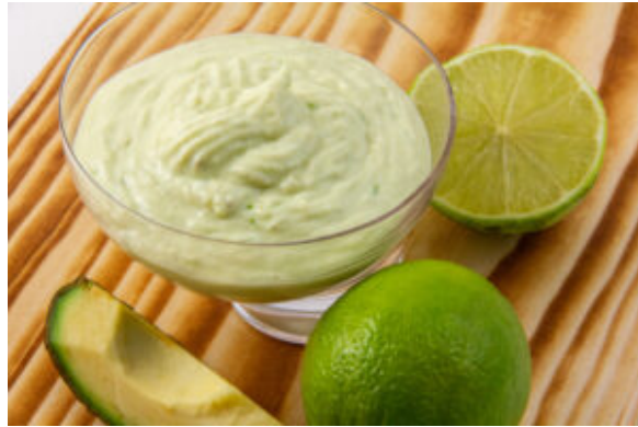
Mayonnaise à l'avocat (recette sauce Thermomix)