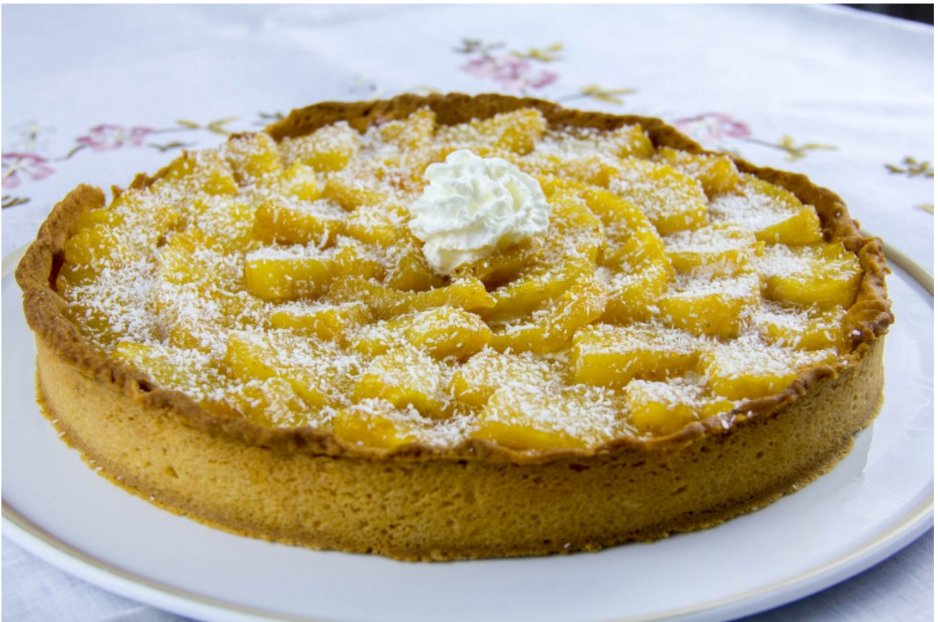
Tarte à l'ananas caramélisée