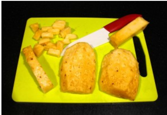
Détaillez l'ananas en cubes