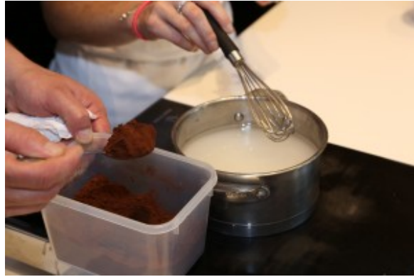
Ajoutez le cacao au sirop