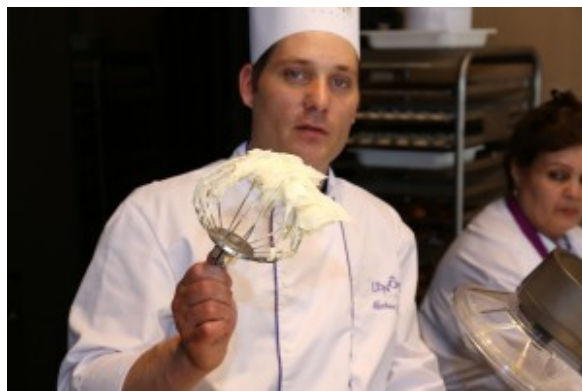
Le « bec d'oiseau »