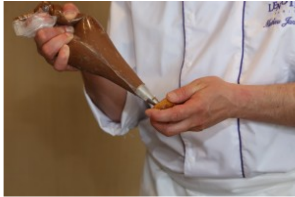
Garnir les choux