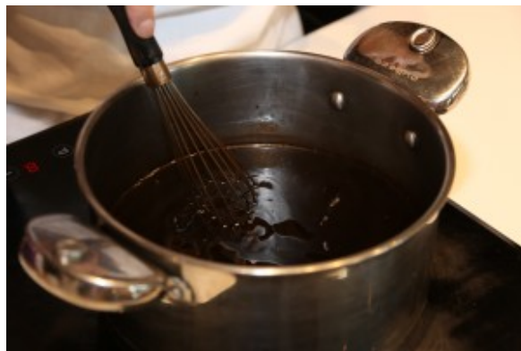
Le fondant est prêt

Votre fondant est prêt: vous allez glacer vos choux.