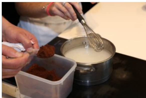
Ajoutez le cacao au sirop