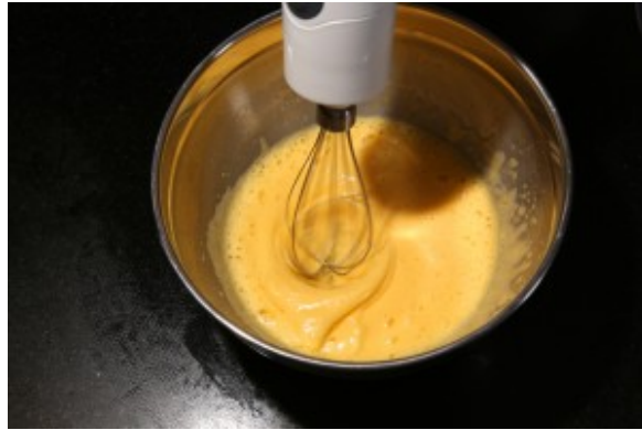
Le mélange a blanchi