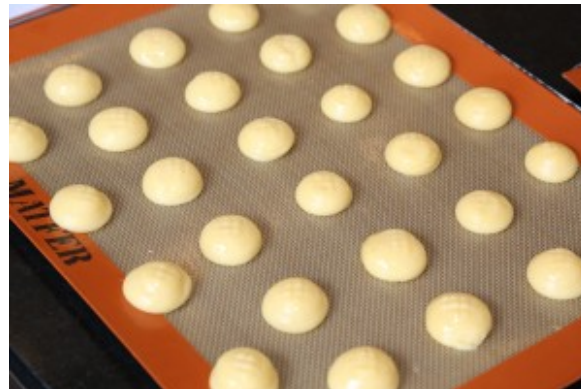
Bon écartements des choux