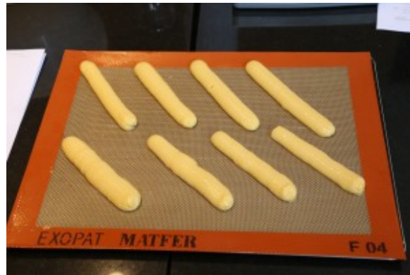
Bon écartement des éclairs