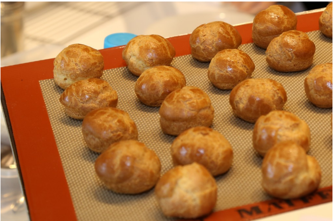
Pâte à choux

La pâte à choux est une des recettes de base de la cuisine française. Si à la lecture elle paraît facile à réaliser, elle comporte cependant quelques écueils et rares sont les cuisinier(e)s à la réussir du premier coup! Car sa bonne pousse au four dépend de plusieurs facteurs: bon desséchage, le bon dosage des œufs qui ne s'acquiert que par l'expérience (cette quantité n'est jamais la même d'une fois à l'autre pour une même quantité de farine), et enfin un couchage régulier.