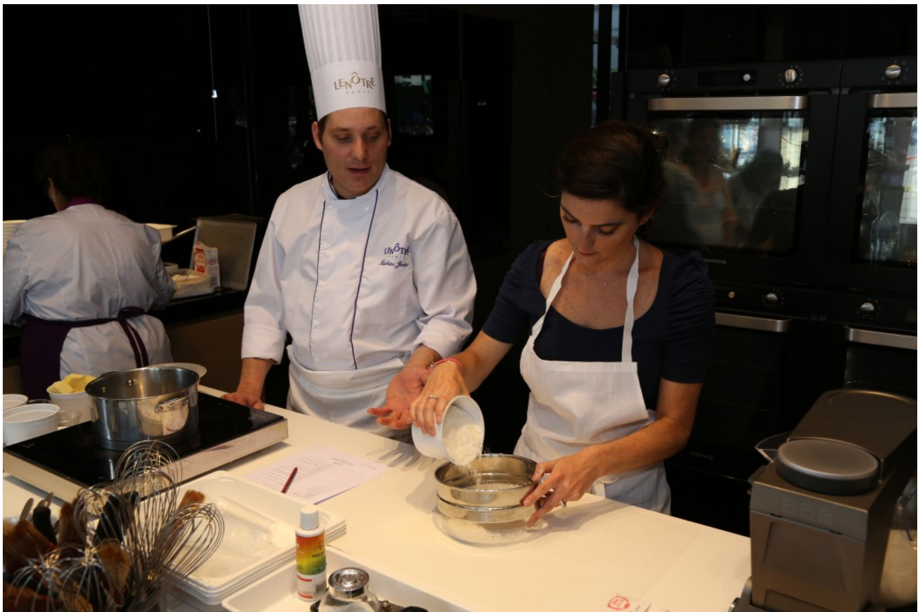
Tamisez la farine